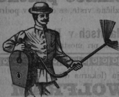
Zastopniki se iščejo!

Trijerji (čistilni stroji za žito) v natančni izvršitvi. Sušilnice za sadje in zelenjavo, škropilnice proti peronospori. Zboljšani sestav Vermorelov. Mehovi za žvepljanje trt. Mlatilnice, mlinci za žito, stiskalnice (preše) za vino in sadje različnih sestav. Slamoreznice jako lahke za goniti in po zelo zmernih cenah. Stiskalnice za seno in slamo, ter vse potrebne, vsakovrstne poljedeljske stroje, prodaja v najboljši izvršitvi