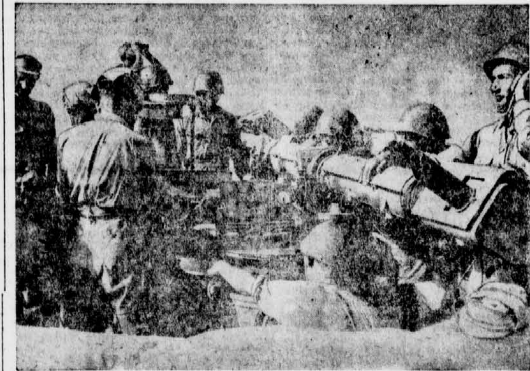
Bei der italienischen Flakartillerie in Nordafrika Am Kommandogerät

Zu Beginn der Neuzeit legten die Pikener ihre Spieße und Hellebarden aus der Hand und griffen zur Arkebuse und Muskete, die 1521 in größerem Umfang und systematisch zuerst im spanischen Heere eingeführt wurden. Damals schickten sich die Haufen der Landsknechte an, eine stärkere Ordnung zu gewinnen, und weitsichtige Truppenführer organisierten ihre Formationen unter Beachtung der Möglichkeiten der neuen Handfeuerwaffen um. Damit hatte sich das Fußvolk endgültig durchgesetzt; bis dahin hatte es in seiner Verwendung neben den Rittern im Grunde immer nur eine untergeordnete Rolle gespielt, man hatte es über die Achsel angesehen, obwohl längst Adel und Bürgertum ihre Söhne im Fußvolk dienen ließen. Die neue Entwicklung führte dazu, daß die Fußtruppen noch stärker als vorher zum eigentlichen Kern und schließlich zum wichtigsten Bestandteil der kämpfenden Heere wurden. Diese Entwicklung hat bis zur Schaffung moderner Heere angehalten. So sehr auch die ständige Verbesserung der Waffen und die Erfindung neuer Kampfgeräte die Wandlung der Aufgaben und die Spezialisierung von Truppenteilen förderten, so wenig wurde dadurch zu irgendeiner Zeit die Bedeutung der Infanterie vermindert. Auch die Technisierung im neunzehnten Jahrhundert und besonders in unseren Tagen konnte die Infanterie aus ihrer unter allen Waffengattungen wichtigsten Position nicht verdrängen: sie erobert, besetzt und bewahrt.