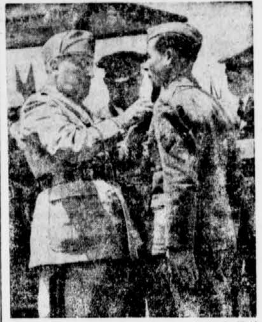
Der Duce und seine Soldaten

Die Zeitschrift drückt klar aus, was auch die Agitation Roosevelts nicht mehr verborgen kann, daß nämlich die Aktion in Nordafrika und die daraus sich ergebenden Nachschubverpflichtungen wegen der steigenden Tonnagenot zu einer weiteren Senkung des allgemeinen Lebensstandards in USA führen muß. Das USA-Volk müßte sich mit dem Gedanken der Engerschnallung des Riemens vertraut machen, da, so sagt „Fortune“, „ohne Schiffe, die die Güter an die Kampffronten befördern, die USA-Produktion zu einer Kraftanstrengung im luftleeren Raum werde.“