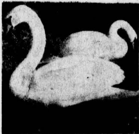
Ein letztes Sonnenbad