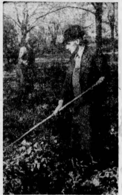
Dem Schnee und Winter wird Platz gemacht

Freuen wir uns der Tage, in denen die letzten Blätter fallen. Bald hängt keines mehr am Ast und das häßliche Wätter setzt ein. Häßlich? Nein. Denn die Natur ist ja nie häßlich, auch wenn es trüb ist, stürmt und schneit. Es kommen ja doch wieder, trotz alledem, Tage der immer siegenden Sonne... Hans Auer