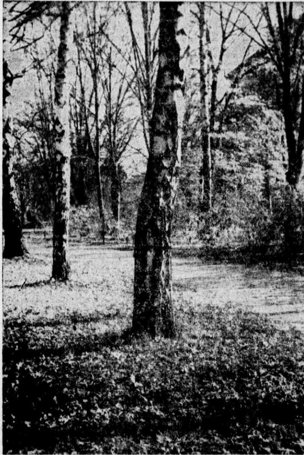
Der Herbst nimmt Abschied im Marburger Stadtpark