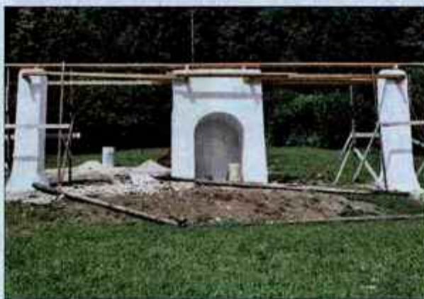
Tinetov kozolec s kapelico v Dražgošah bo prava paša za oči.

Turistična pot Dražgoških spominov bo zajemala tudi ogled spomenika, Bičkove skale, vzletišča jadrskih padalcev, staro pokopališče, objekt za sušenje lanu, cerkev in seveda Tinetov kozolec. Na zidanemu delu bodo v kratkem pritrtili tudi leseno kritino "šinkeljne", sledi pa še najimunitnejši del - poslikava kapelice. Po dogovoru s