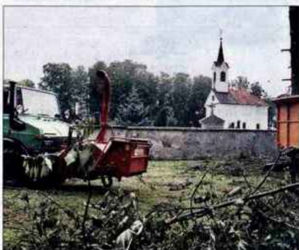
Po odstranitvi dreves in prekopu nemških vojakov naj bi to mesto zasedli avtomobili.

Škofja Loka - Ministrstvo za delo, družino in socialne zadeve je že leta 2000 izdalo dovoljenje za prekop posmrtnih ostankov nemških vojni ujetnikov za mestnim pokopališčem v Škofji Loki. Zaradi večjih dreves je bil prekop prekinjen, občina pa se je pred dne-