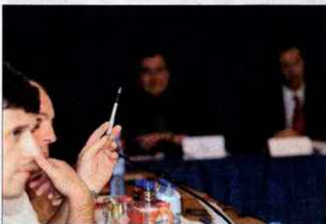
Za razpis referenduma je glasovalo dvanajst svetnikov, proti ni bil nihče.