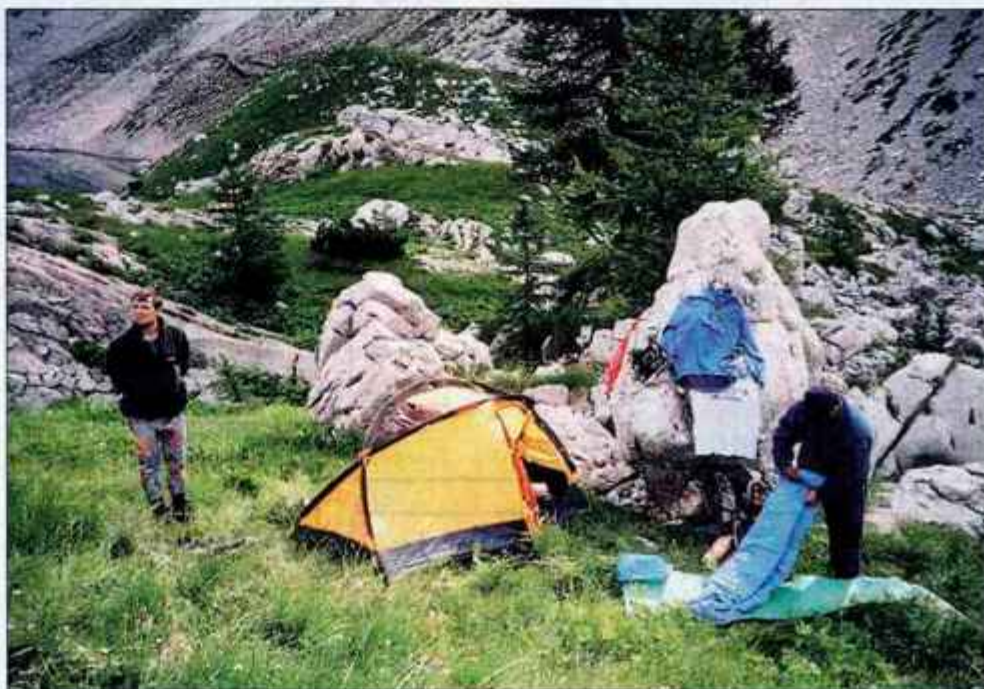
Neustrezno opremljeni planinci pogosto taborijo na neprimernih mestih.

Letos so zaradi manjšega števila obiskovalcev - sezona obiskov gora je bila bistveno krajša kot lani - zaznali tudi manj problemov. "Ljudje so tudi vse bolj ozaveščeni," meni Šolar. Vendar pa so se Čehom, Slovkom