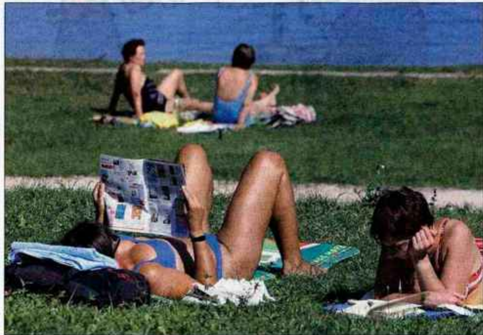
Poletje se posavlja, kopalni dnevi, kot kaže posnetek, bodo bolj redki, turistični delavci pa že ocenjujejo sezono.

Gorenjske lokalne turistične organizacije pripisujejo porast števila gostov in nočitev v primerjavi s prejšnjimi leti bogatejši turistični ponudbi.