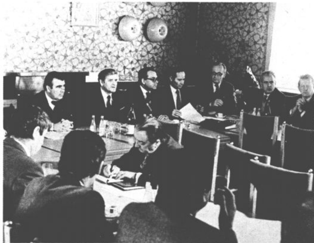
Predstavniki izvršnih svetov Kosova in Slovenije med pogovorom v Gorenju.