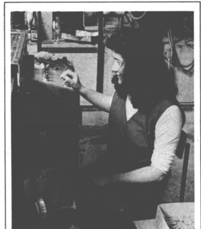
Stabilizacijske naloge so v naših rokah