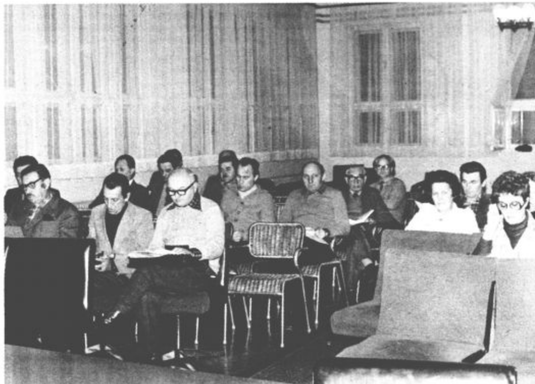
S seje skupščine krajevne skupnosti Šoštanj