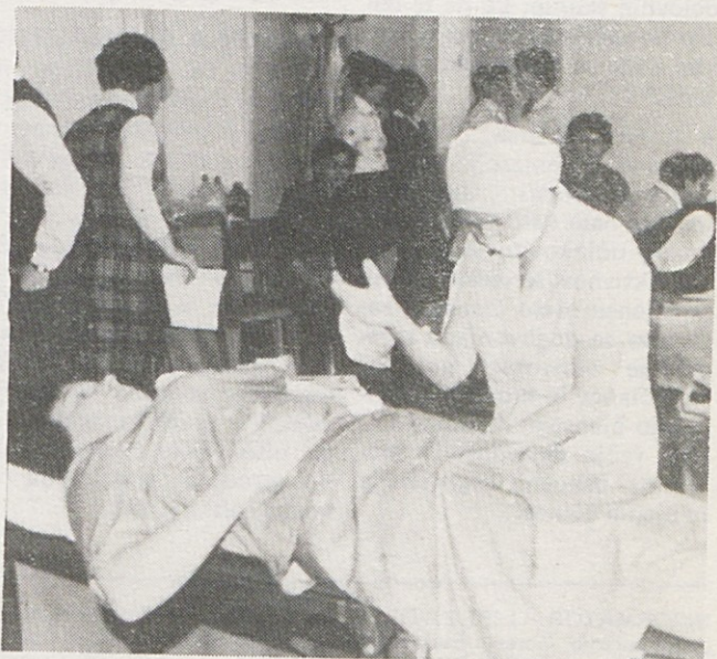
Krvodajalstvo ima v Gorenju lepo tradicijo in se humanih akcij udeležuje vse več delavcev.

Po ogledu proizvodnje v nekaterih delovnih organizacijah sozda Elektrokovina in v Tovarni avtomobilov Maribor, so gostitelji pripravili še zaključek, ki je še enkrat potrdil humanost krvodajalcev.