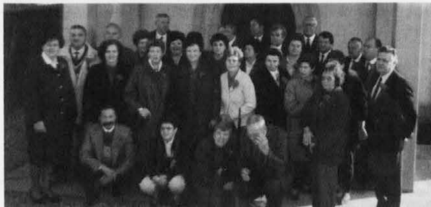
Šestdesetletniki pred cerkvijo

Ker je v četrtek, 8. decembra, praznik, bo KATOLIŠKI GLAS izšel že v sredo, 7. decembra. Zato prosimo sodelavce in druge bralce naj pošljejo vse prispevke najkasneje do ponedeljka, 5. decembra ob 12. uri.