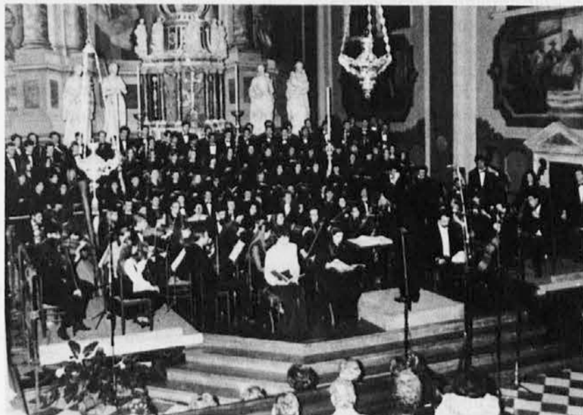
Izvedba Sattnerjeve kantate predstavlja pomemben glasbeni dogodek. Občinstvo je to priznalo z izredno udeležbo. Članek je na goriški strani