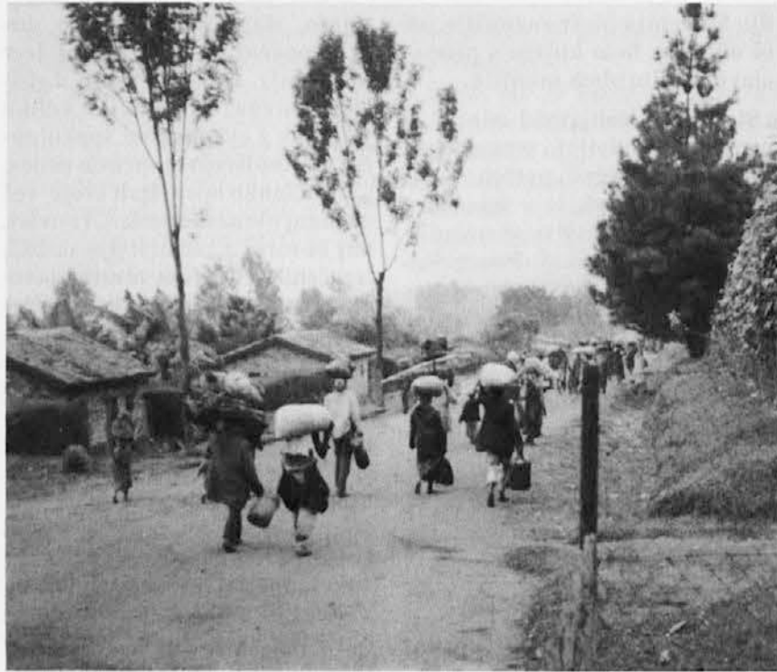
Beg pred smrtjo v neznanu

Svet je danes skorajda že pozabil na begunce iz Ruande, ki so zbrani okrog mesta Goma v afriški državi Zaire, ki jo vodi diktator Mubutu. Okrog Gome je nastanjenih še najmanj 900 tisoč Hutujcev, ki so se zatekli v bližnji Zaire pred novo oblastjo v matični državi. Čeprav vladajo sedaj v Ruandi zmerni Hutujci, se ubežniki bojijo maščevalnih podvigov Tutsijev, ki so jih prej Hutujci klali. Državljanska vojna, ki je prinesla najmanj milijon smrtnih žrtev, je sprožila tudi masovne bege iz države. Prav begunci so danes največje žrtve te vojne, saj so skorajda prepuščeni sami sebi, pa čeprav pošiljajo OZN in druge humanitarne organizacije v begunske centre veliko in do-