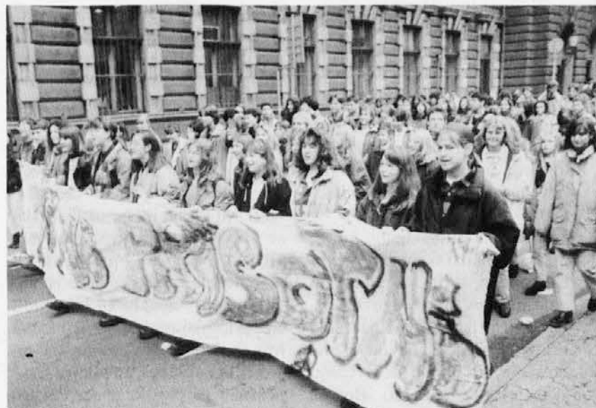
Tudi dijaki slovenskih višjih srednjih šol so se pridružili protestu proti vladnemu finančnemu zakonu