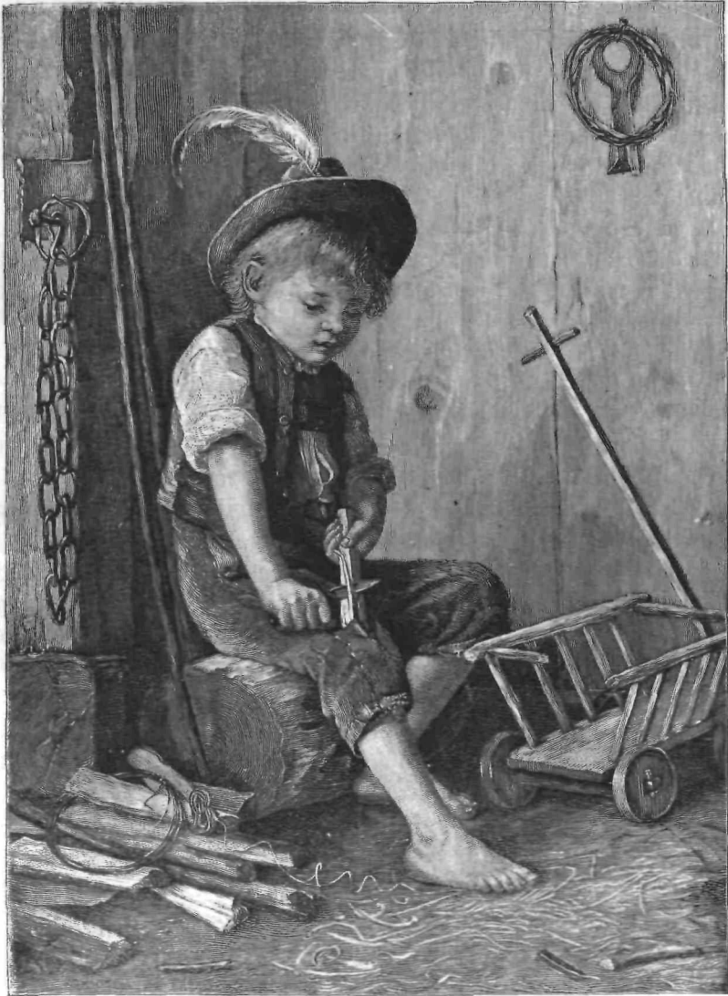
V zadnjem hipu.