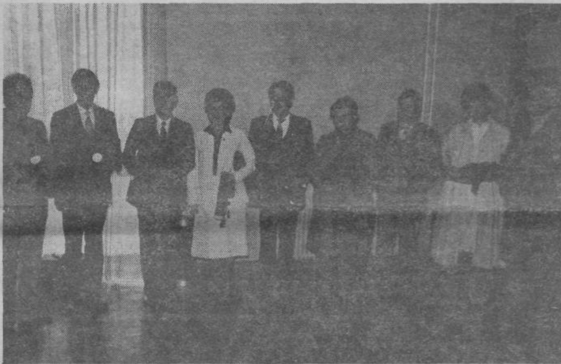
Letošnji dobitniki nagrad in priznanj Louisa Adamiča in Josipa Jurčiča.