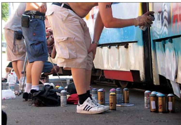
Novi tramvaji

more k temu, da so njihove umetniške akcije odgovor na problematiko lokacije. Cilj posameznega projekta je izobraževanje široke javnosti in vzpostavljanje novih sistemov v procesih oblikovanja javnega urbanega prostora. Gre za sistem vključenosti umetnosti v proces načrtovanja, pri čemer se z aktiviranjem krajevne skupnosti in mestnih akterjev oblikuje nova podoba zapuščenih krajev. Začetek tvorstne metodologije sega v obdobje Beaux – arta, v ZDA pa je znana