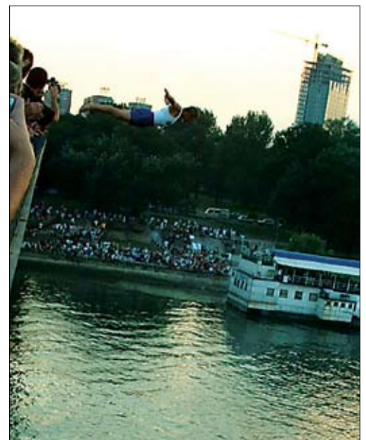
Skoki z mostu