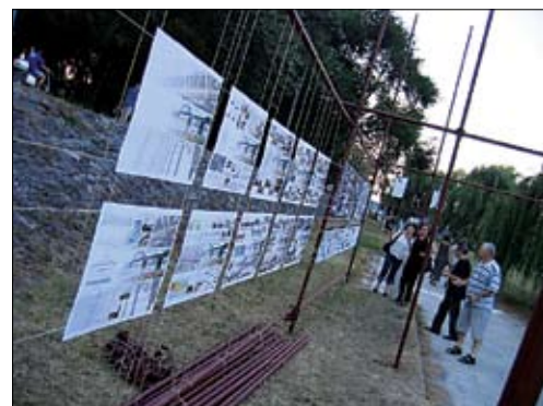
Aktivnosti na obrežju