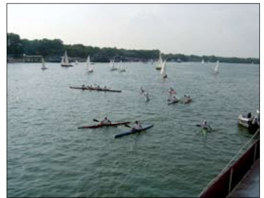
Aktivnosti na reki