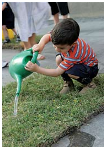
Javni prostor – javna umetnost

jektom se je ustvarila nova scenografija mesta, kjer se je s pomočjo umetniških predstavitev temeljito opredelila nova pot za obiskovalce iz mestnega jedra do reke Donave. Dostopnost do reke se je ustvarila z novimi prizorišči performansa, raz-