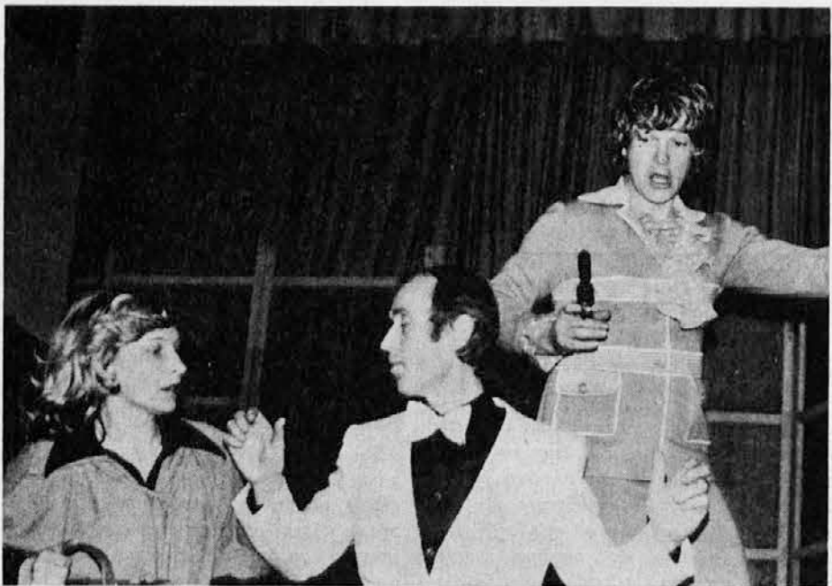
Prizor iz komedije »Strogo zaupno«, ki so jo člani dramske skupine PD »Standrež« uprizarili v nedeljo 17. februarja v Katoliškem domu v Gorici