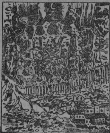
Vidmaric kaže kmetom moč „Pakraških kapljic“ in „Slavonske zeli“.

Pakraške kapljice in slavonska zel, to sta danes dve najpriljubljenejši ljudski zdravili med narodom, ker ta dva leka delujeta gotovo in z najboljšim uspehom ter sta si odprla pot na vse strani sveta.