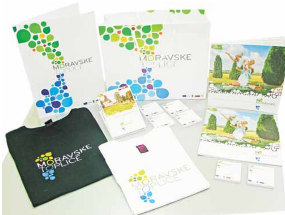
Vsi nastali materiali

Z zbranimi kulturnimi in naravnimi danostmi v zemljevidu, ki so tokrat povezane v skupno destinacijo »Poti dediščine«, pa so poleg že obstoječih kolesarskih in pohodnih poti prikazane različne možnosti aktivnega počitnikovanja, ki obiskovalcem olajšajo raziskovanja Moravskih Toplic in okolice.