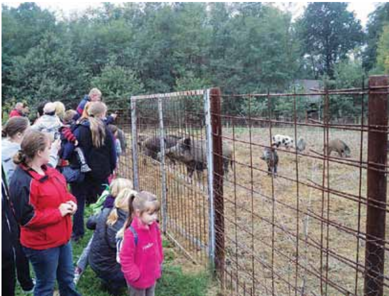
Ogled obora, v katerem so nameščene divje svinje, je bil za najmlajše prava paša za oči.