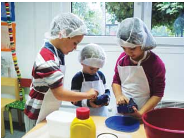
Najmlajši so se lotili tudi priprave tuninega namaza, s katerim so se okrepčali njihovi dedki in babice.

»Otroci babici in dedka naravnost obožujejo. Zavedajo se, da imajo ves čas tega sveta samo zanje. Nikoli se jim ne mudi, pri njih se vsa domača pravila malce spremenijo. Dovoljeno jim je odpirati omare, pred kosilom jesti čokolado, če ne želijo jesti paradižnikove juhe, jim bo babica pripravila najboljše palačinke. Odhod v posteljo se lahko neomejeno podaljša. Igrače bo pospravil dedek, medtem bo babica vsem pripravila okusen kakav...Kako je sploh mogoče, da otroci v družbi starih starših ne bi uživali? ( http://www.bibaleze.si/clanek/malcek/babice-in-dedki-so-zakon. )«