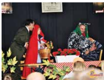
V eni od predstav sta se srečala tudi Rdeča kapica iz Koroške in volk iz Primorske, in sicer brez komunikacijskega šuma