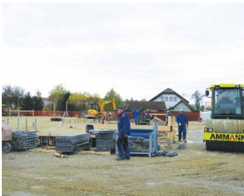
Gradbeni stroji so že na delu, še letos naj bi bila zgradba pod streho, novega vrtca pa se bodo otroci in starši razveselili še pred prihodnjim poletjem.

Ob objektu se ustrezno uredi tudi okolica objekta. Izvedejo se parkirišča za zaposlene in stranke. Za objektom se uredi zelenica. Okrog kompleksa vrtca bo zgrajena ograja.