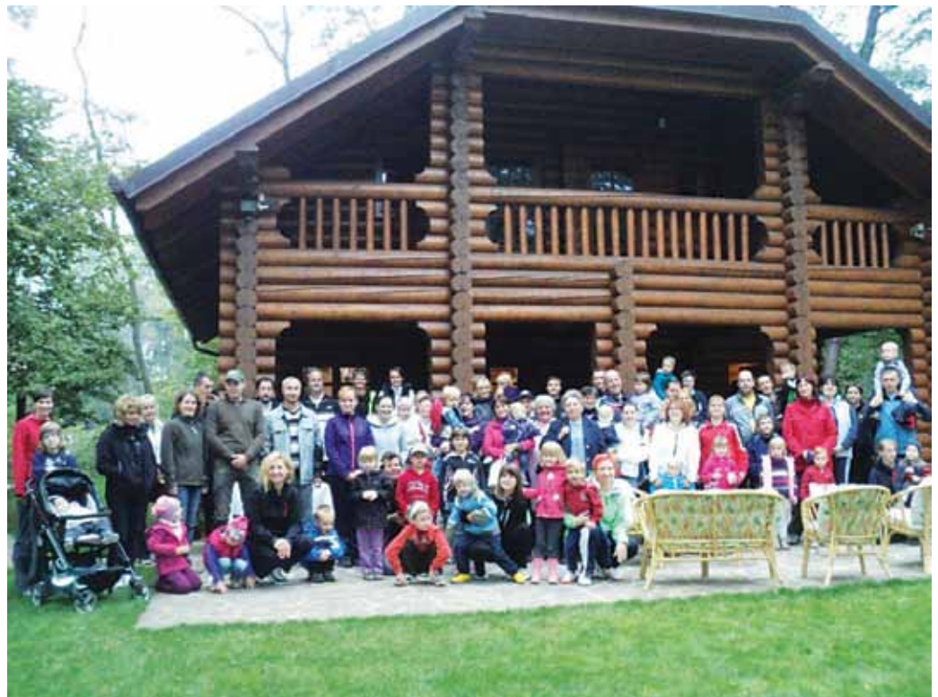
Za konec presenečenja, kajti pri hišici v zeleni hosti je zadišalo po pečenem kostanju