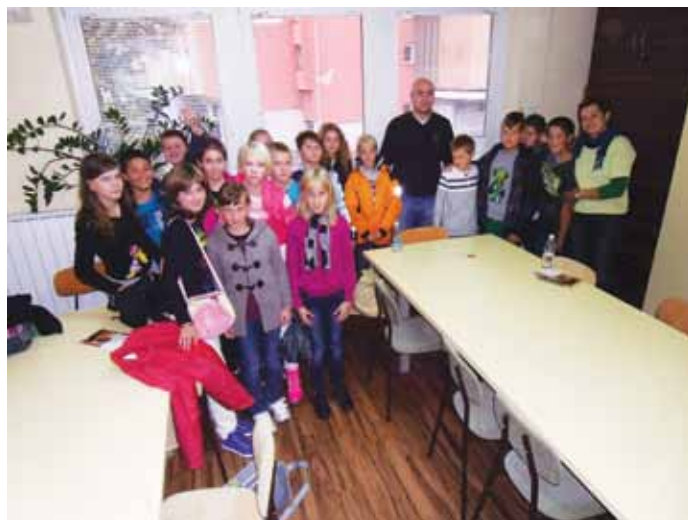
Mladi so med obiskom sedeža Rdečega križa prisluhnili predavanju o škodljivosti kajenja.

Mladi so danes pravzaprav vsepovsod izpostavljeni raznorodnim razvadam oziroma škodljivim navadam. Eno takšnih je seveda tudi kajenje. Raziskave po svetu in v Sloveniji opominjajo na to, da je zdravje ljudem najpomembnejša vrednota. Zato je nujno opozorilo, da postane kajenje z leti huda odvisnost, ki ogroža zdravje in omejuje osebno svobodo, nekajenje pa postaja vrednota za zdravo in sproščeno življenje. Saj je varovanje zdravja v resnici dolgotrajna naložba in tako tudi nekajenje prinaša tem večji dobiček, čim prej se vsak posameznik zanj odloči.