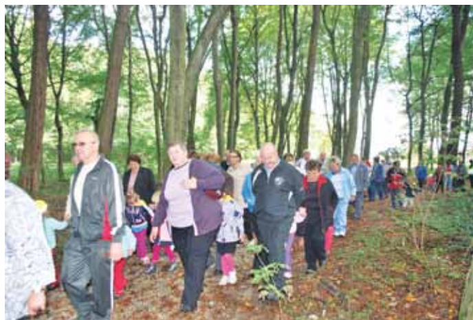
Pot ni bila vsakdanja, saj je bilo treba skrbno prebrati navodila, da nam je uspelo najti skriti zaklad, jabolka.

Ura je neizmerno tekla in že krepko pred dogovorjeno uro se je vrtčevsko igrišče začelo polniti. Ob deseti uri smo se ven odpravile tudi strokovne delavke z otroki. Na začetku so vsi otroci hiteli k svojim dedkom oz. babicam, se malo pocartali nato nam jih pa ponosno predstavljali. Sledila je skromna pogostitev nato pa pohod z dedki in babicami. Naši najmlajši otroci so se v spremstvu starih staršev in strokovnih delavk odpravili na sprehod v bližnji okolici vrtca, ostali dve skupini sta pa združeni odšli iskat skriti zaklad na trim stezo. Med samim iskanjem so nam pravilno pot kazale puščice, izvajati smo pa morali tudi različne naloge, ki so nam popestrile naš pohod. Naša pot je bila zanimiva in precej športno obarvana. S