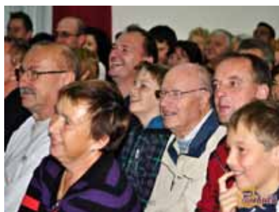
Od smeha in dobre volje so pordela tudi lička