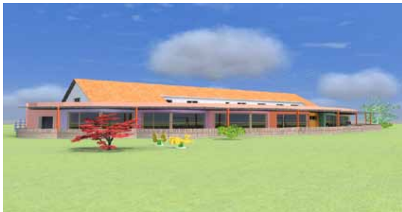
Tako naj bi izgledal nov vrtec.

Za ogrevanje je predvidena toplotna črpalka ter za dogrevanje nizkotemperaturni plinski kotel. Pretežno je talno gretje, v manjšem delu so predvidena druga grelna telesa. Prezračevanje objekta je preko centralnega klimata z avtomatsko regulacijo.