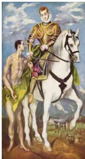
El Greco: Sveti Martin in berač

God svetega Martina je izročilno dan, ko se mošt spremeni v vino. Vinska stroka napoveduje, da bo letošnji letnik sicer skromnejši po količinah, zato pa izjemen po kakovosti. V vseh vinorodnih območjih so tudi letos počastili god svetega Martina s številnimi prireditvami – martinovanji in v skladu s šegami in običaji s krstom mošt spremenili v vino. Tudi v naši občini so vrli vinogradniki in društva pripravili martinovanja od Prosenjakovcev, preko Filovcev, Bogojine, Suhega vrha in drugih vinogradniških krajev. Več o teh dogodkih v naslednji številki Lipnice.