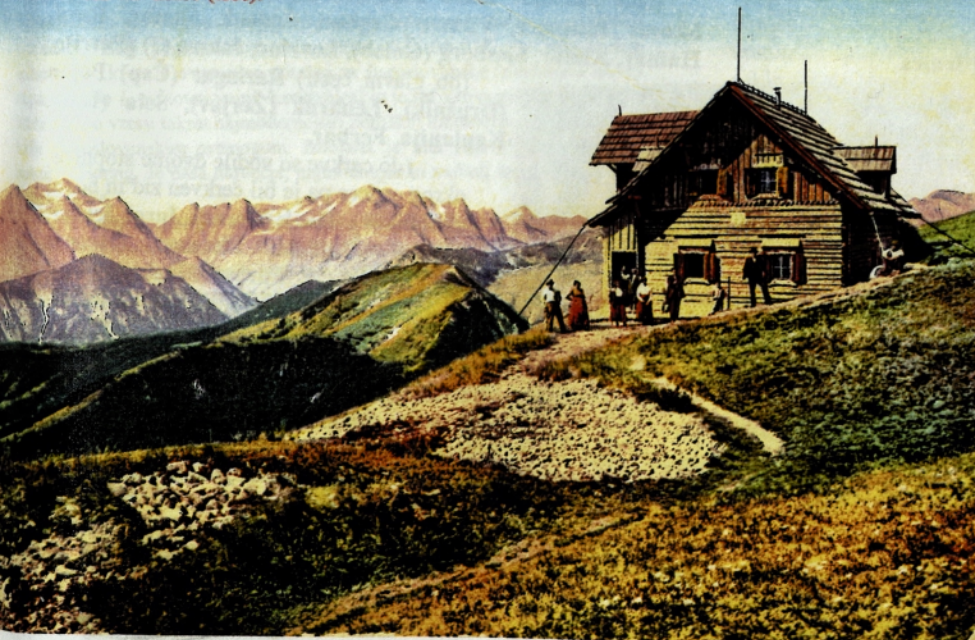
Radnikova Koča vrh Golice (1836).

Razglednica Golice pred prvo svetovno vojno