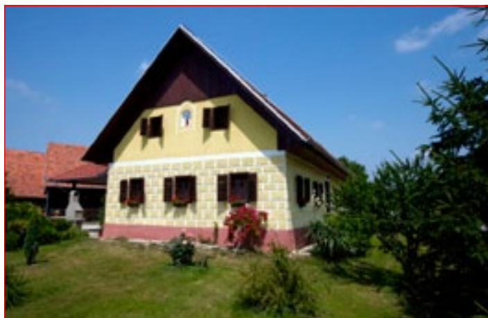
Posebno priznanje za ohranjanje tradicije življenja na vasi in arhitekturne dediščine je prejela kmetija Zupanič z Grajene 31.