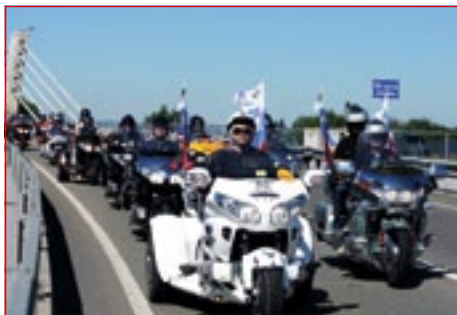
Na Ptuj je bilo moč videti 232 Goldwingov iz 18 evropskih držav.

Naše kraje je obiskalo več kot 500 obiskovalcev iz celotne Evrope. Organizatorji so zabeležili kar 232 motorjev Goldwing iz tujine brez članov Goldwing kluba Slovenija, ki so kot organizatorji ob Termah Ptuj ter Podravsko-ptujsko-ormoško regionalno destina- cijsko organizacijo poskrbeli za vse varnostne in logistične zadeve. Gostje so lahko uživali v kulinarčnih, etnoloških, naravnih in zgodovinskih zanimivostih na Ptujskem in v okolici.