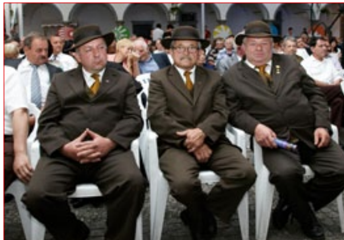
ZČD Ptuj združuje 235 čebelarjev, ki imajo povprečno 20–30 panjev.

Zveza organizira tudi strokovne ekskurzije, ki so namenjene spoznavanju čebelarstva v Sloveniji in tujini. Vsako leto se udeležijo čebelarskega sejma v Celju, bili so še v Bjelovaru in Beogradu, letos pa se prvič odpravljajo v Sarajevo. Zveza čebelarških društev Ptuj je ena prvih, ki je uvedla vzgojno-izobraževalno