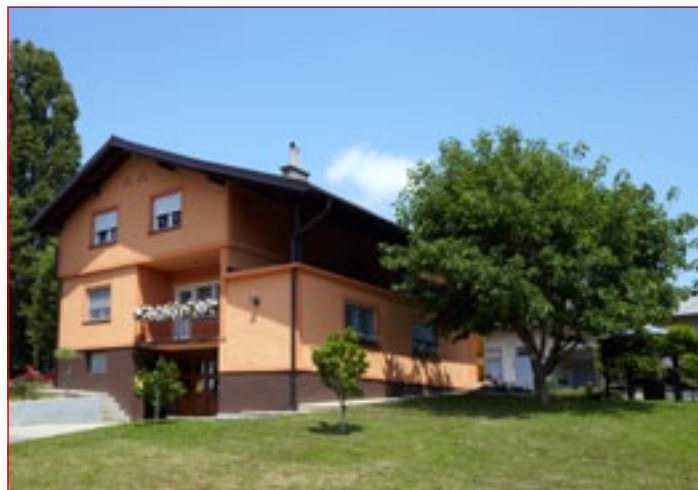
Živinorejska kmetija Kokol iz Krčevine pri Vurberku 106

Vsi skupaj se trudijo za urejenost tako hiše kot okolice, kjer je veliko cvetja, jagodičevja in sadnega drevja. Pred hišo lepo cveti tudi 100 let stara vrtnica. Hiša je dobila še lepši in modernejši videz pred petimi leti, ko so v celoti uredili fasado, ki so jo mojstri obnavljali ročno.