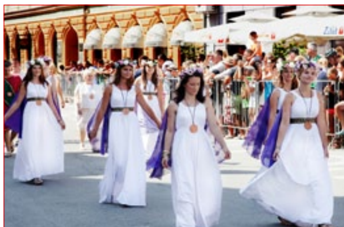
Rimske igre 2012

s Turistično organizacijo mesta Niš iz Srbije podpisal listino o sodelovanju na področju turizma. V Termalnem parku Term Ptuj, osrednjem prizorišču dogajanja, so sodelujoče skupine postavile rimski tabor z 28 šotori, kjer so obiskovalci lahko doživeli utrip rimskega vsakdana. Med drugim so si gostje lahko ogledali tudi bitko med Rimljani in barbari, rimski spektakel, gladiatorske šole, zasedanje senata v rimskem amfiteatru in prikaze