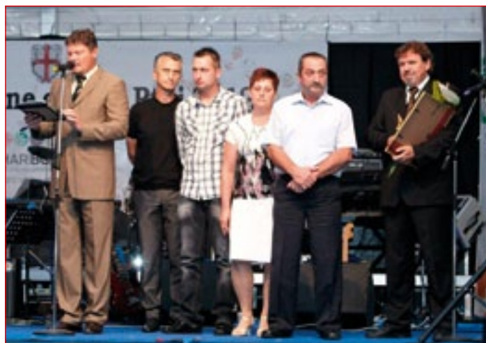
Člani družine Kokol, prejemniki priznanja Kmetija leta 2012

razglasitev kmetije leta MO Ptuj, balonarski praznik, mednarodno srečanje motoristov, ptujška rancarija s tekmovanjem in razstavo, turnir v balinanju, odprtje razstav mednarodnega likovnega