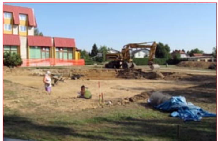
Zaščitna arheološka raziskava na lokaciji izgradnje nove OŠ dr. Ljudevita Pivka ob Dijaškem domu Ptuj

32, iz Gornje Radgone, STRABAG gradbene storitve, d. o. o., Letališka cesta 33, iz Ljubljane, MarkoMark, d. o. o., Pobrežje 6 a, iz Vidma pri Ptuj, GP Project ing., d. o. o., Vošnjakova 6, s Ptuja, in SGP Tehnik, d. d., Stara cesta 2, iz Škofje Loke. Začetek z deli bo možen takoj po podpisu pogodbe z izvajalcem, predvidoma v oktobru. Rok trajanja gradnje je predviden 12 mesecev od začetka gradnje, torej do oktobra