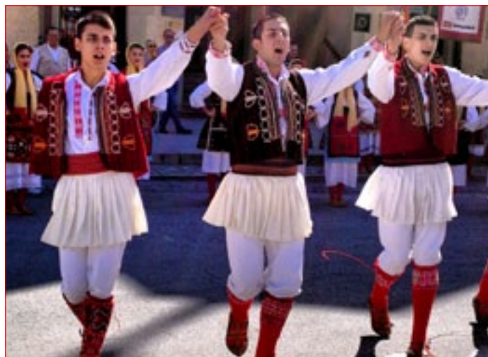
Na mednarodnem festivalu Folklorni kimavčevi večeri so poleg skupin iz Slovenije sodelovale še skupine iz Hrvaške, Bosne in Hercegovine in Makedonije.