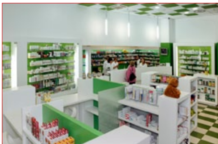
Lekarna Budina - Brstje v TC Qlandia

popolnoma odrezala, nato pa v prostorih trgovskega centra, kjer vsi pogoji (možnost parkiranja, ponudba različnih storitev in izdelkov na enem mestu) prispevajo k dobri umeščenosti lekarne. Že kmalu je postala lekarna pre-