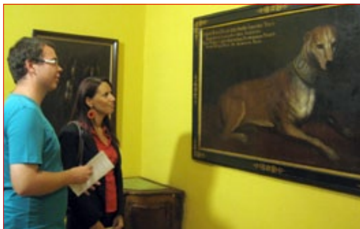
Slika iz 17. stoletja s podobo psa, ki se tesno navezuje na ptujsko zbirko turkerij, razstavljenih v slavnostni dvorani ptujskega gradu.