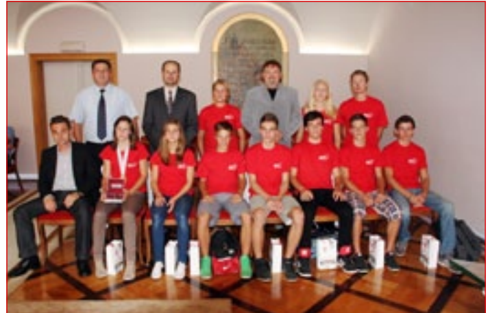
Skupinski posnetek v poročni dvorani; ptujska atletska ekipa v majicah, v katerih so v Daeguju zastopali Ptuj in Slovenijo.