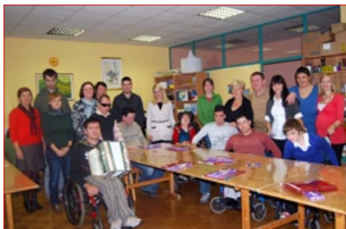
Zaključno srečanje udeležencev izobraževanja UŽU – Moj korak v sodelovanju z društvom Sonček Ptuj

Izvajamo pa še delo s posamezniki, do česar je pravzaprav prišlo naključno. Ob motivacijskih