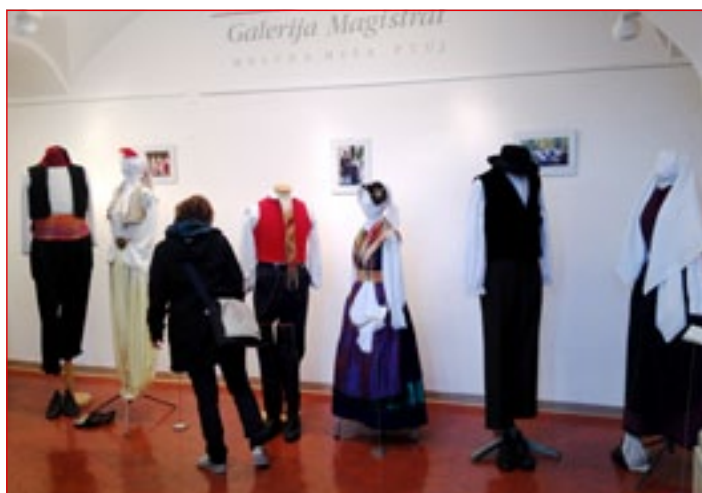
V Galeriji Magistrat je na ogled mednarodna razstava ljudskih kostumov.

za oživljanje in ohranjanje tega področja dediščine. Poudaril je