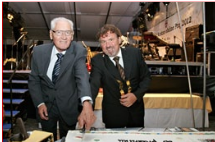
»Nagrada je priznanje za življenjsko delo. Je vrednota in čast, ki mi je bila s tem imenovanjem izkazana in za katero sem hvaležen.«

ti z razpoložljivimi sredstvi. V tem mandatu je na razpolago okrog 25 milijonov evrov mo-