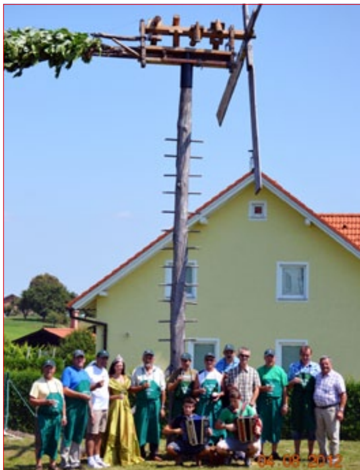
Na posestvu Biotehnične kmetijske šole Ptuj so člani društva vinogradnikov in sadjarjev Osrednje Slovenske gorice postavili enega večjih slovenjegoriških klopotcev.