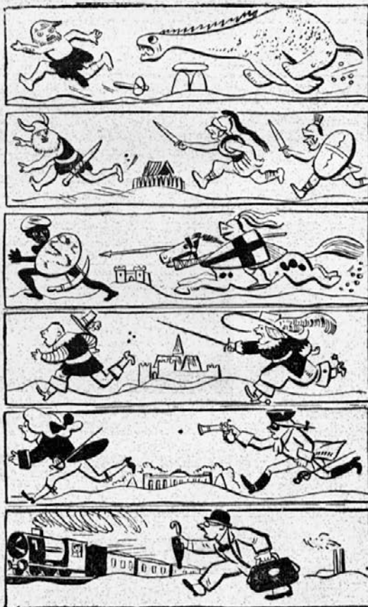
Zgodovina teka v angleški karikaturi.

Veliko važnost polaga v zadnjem času češko Orlovstvo na to, da vzgoji svoje članstvo v obrambi domovine, kadar bi bila v nevarnosti. V ta namen prireja po svojih župah posebne tečaje, pri katerih sodelujejo tudi vojaške oblasti, ki gredo češkemu Orlu v vsakem pogledu zelo na roko.