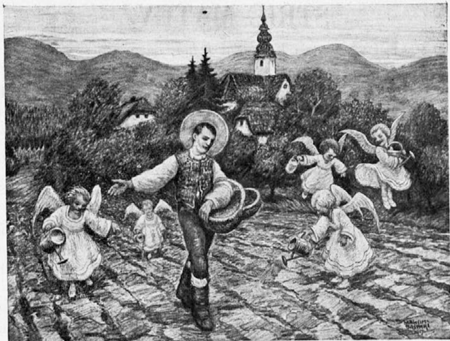
Sveti Izidor, zaščitnik poljedelcev