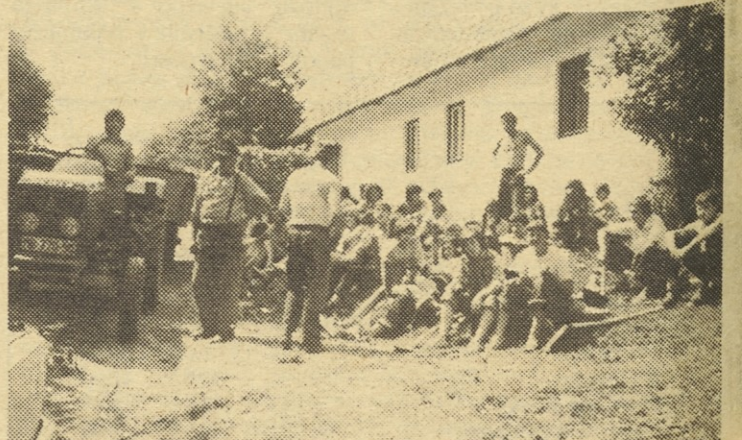
Po napornem delu smo včasih tudi posedeli in poklepetali z domačini.