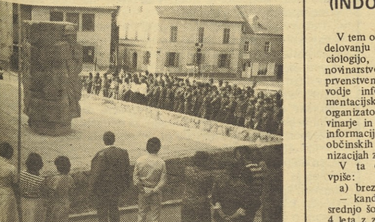
Brigadirji iz Ščavnice so se srečali z brigadirji iz Bačke Topole ob spomeniku NOB v Lenartu.