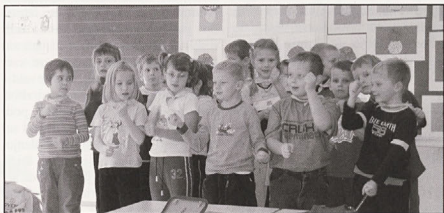
Mladost je polna prijetnih presenečenj