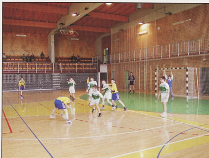
Veliko nastopajo tudi mlajše selekcije RK Gorišnica. Nazadnje so se pomerili z vrstniki Gorenja iz Velenja.