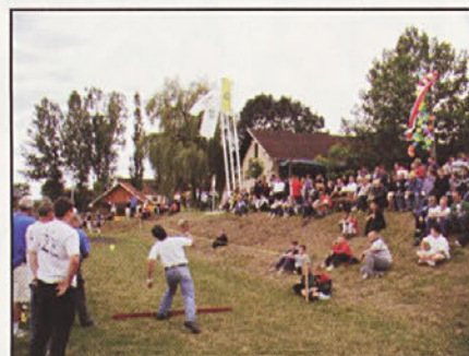
Najbolj množična prireditve ob občinskem prazniku je vaška olimpiada