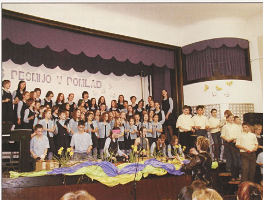
Mladi pevci v polni kulturni dvorani v Gorišnici

Tako kot vsako leto, pa so se tudi letos na koncertu poslovile pevke, ki končujejo osnovno šolo. Zborovod-