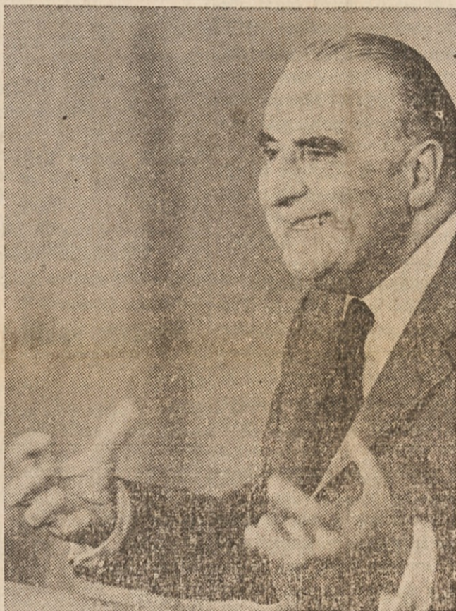
NAZORNO POVEDANO — Predsednik Francoske republike George Pompidou nazorno razlaga svoje poglede na Evropsko gospodarsko skupnost časnikarjem v Parizu.