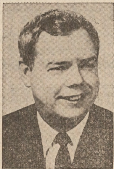
JUDGE FRANCIS J. TALTY