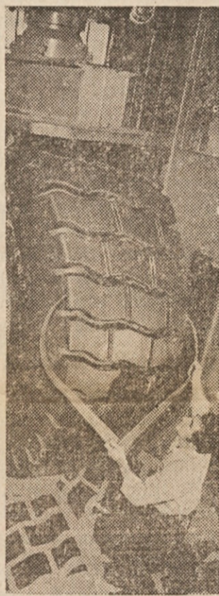
ZADNJI PREGLED — Nadzornik v tovarni gum v Akronu v Ohiju meri in pregleduje ogromno gumo za na stroj za odstranjevanje zemlje.

sicer mi bo še težje opisovati ti svojo bedo. — — Bil sem že preje poročen. Zal da ti pred najino poroko nisem razjasnil svojega prejšnjega življenja; to je, kar me tako zelo peče. Torej imel sem že ženo. Pa ta moj zakon ni bil srečen; nisva bila namreč drug za drugega — zakaj, to ti povem pozneje... Prigodila se je velika nesreča, pri kateri je navidezno umrla tudi moja žena. Cela vrsta mož mi je zadržilo pod prisego, da je res umrla; pa so bili tudi tako jasni sledovi in znaki, da nihče ni mogel dvomiti o njeni smrti. — Čez nekaj časa po tem dogodku sem zapustil oni kraj in se preselil na Gorenjsko. Tu sem spoznal tebe in te vzljubil. Pred najino poroko so mi poslali iz mojega prejšnjega bivališča postavno potrdilo, da sem prost. Vse je bilo pravilno potrjeno s pečatom in podpisom postavnih