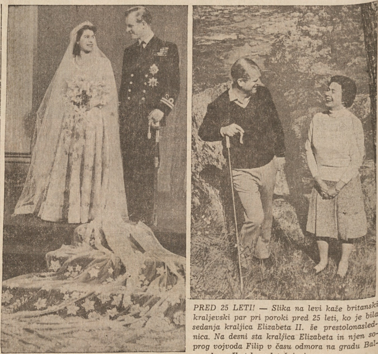
PRED 25 LETI! — Slika na levi kaže britanski kraljevski par pri poroki pred 25 leti, ko je bila sedanja kraljica Elizabeta II. še prestolonaslednica. Na desni sta kraljica Elizabeta in njen soprog vojvoda Filip v času odmora na gradu Balmoral na Škotskem letošnjo jesen.