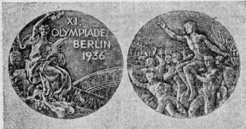
Nagrada za olimpijske zmagovalce je taka, kakršne so bile kolajne pri prejšnjih olimpijskih igrah, le napis je drugi.

Človek, ki posluša udarjanje tega bobna, meni, da so vsi glasovi enaki. Zvok se mu zdi dolgočasen in monoton. Toda udarci na »tam-tam« niso samo daljši ali krajši, marveč predstavljajo celo pesem močnejših in šibkejših, višjih in nižjih zvočnih tresljajev, katere pa more razbrati in razvozlati samo vajeno in neskončno ostro uho zamorskega »brzjavnega« izvedenca.