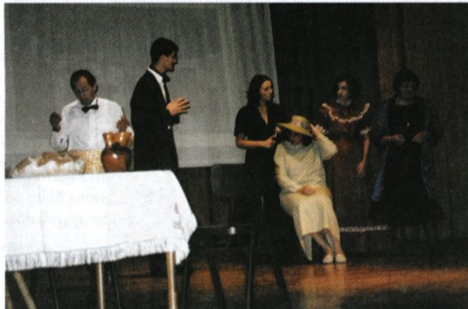
Igralci KID Limbar so z odlomki iz iger Učenjak in Naš naraščaj obudili spomin na dramatiko Frana Detele.