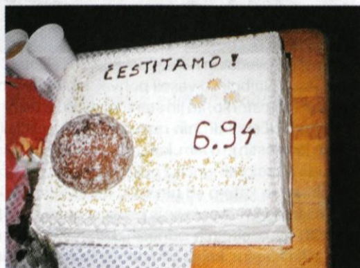
Torto je prispevala družina Kveder