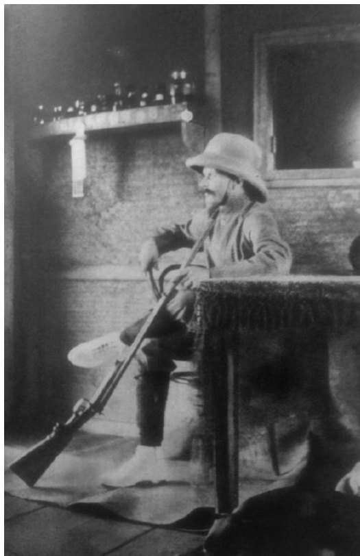
Slika 2: Ferdinand Lupša. Fotografija je bila objavljena v njegovi knjigi iz leta 1930.

Ljutomer – Murska Sobota naleteli na arheološke ostanke, ki jih je šel proučit med drugimi tudi Lupša. Take objave nam pripovedujejo o njegovem zanimivem življenju. 48