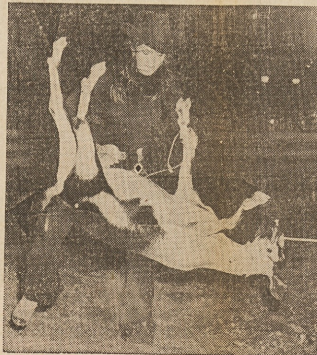
DOBRO SE DRŽI! — Na tekmovanju Ameri- can Junior Rodeo v Pu- eblo, Colo., so kazali mladi fantje in dekleta svoje sposobnosti. Sliki sta posneti s tega tekmo- vanja, na katerem je bi- lo razdeljenih daril in nagrada za $30,000.