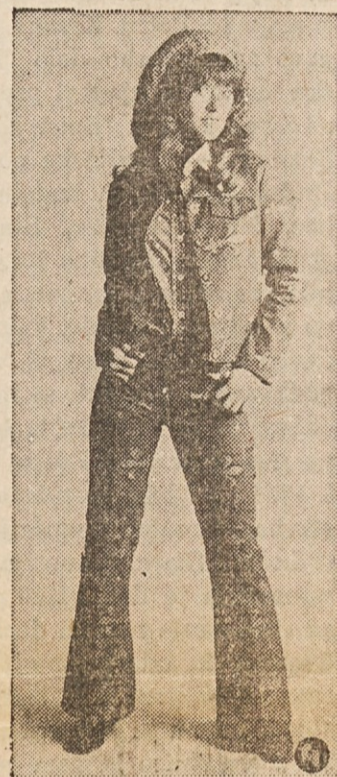
SOFT TOUCH — Brushed cotton denim in navy over- printed with red creates a junior pants outfit with all the western flavor of a Texas sunset. It's teamed with a red and white dotted shirt with frosted collar. By Jeenz.

Mi v srečih nosimo ljubeče, spomin na čase skupne sreče, žalujemo in molimo, dokler se spet ne snidemo.