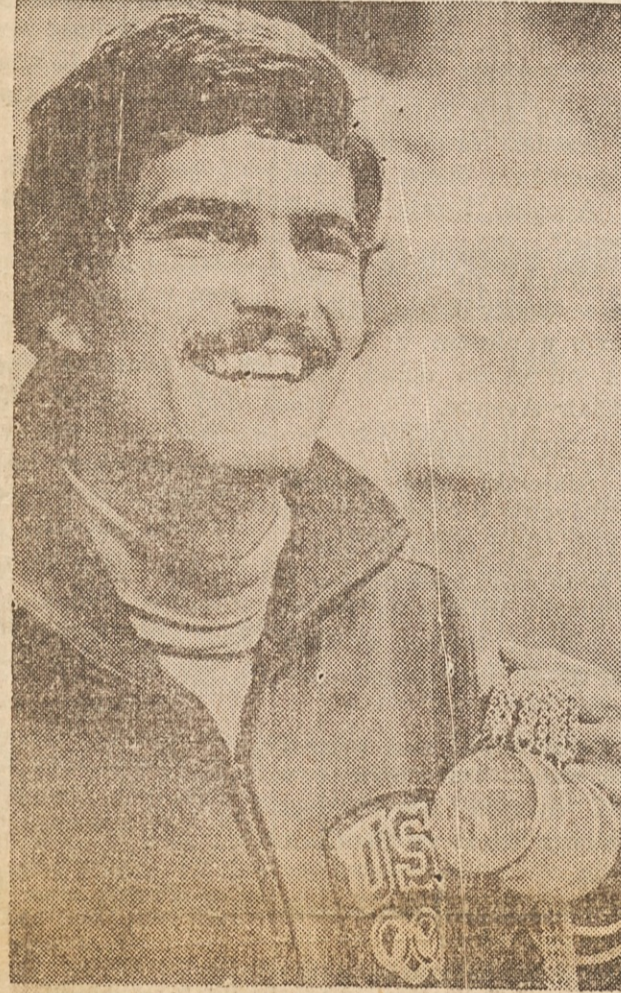
MARK SPITZ se je pustil fotografirati s petimi zlatimi medaljama na olimpijadi v Muenchenu. Ko je dobil še zad- nji dve in jih imel skupaj sedem, je fotografiranje z njimi odklonil brez posebne večje nagrade. On je edini športnik, ki je kdaj dobil več kot 5 zlatih medalij na olimpijskih igrah.