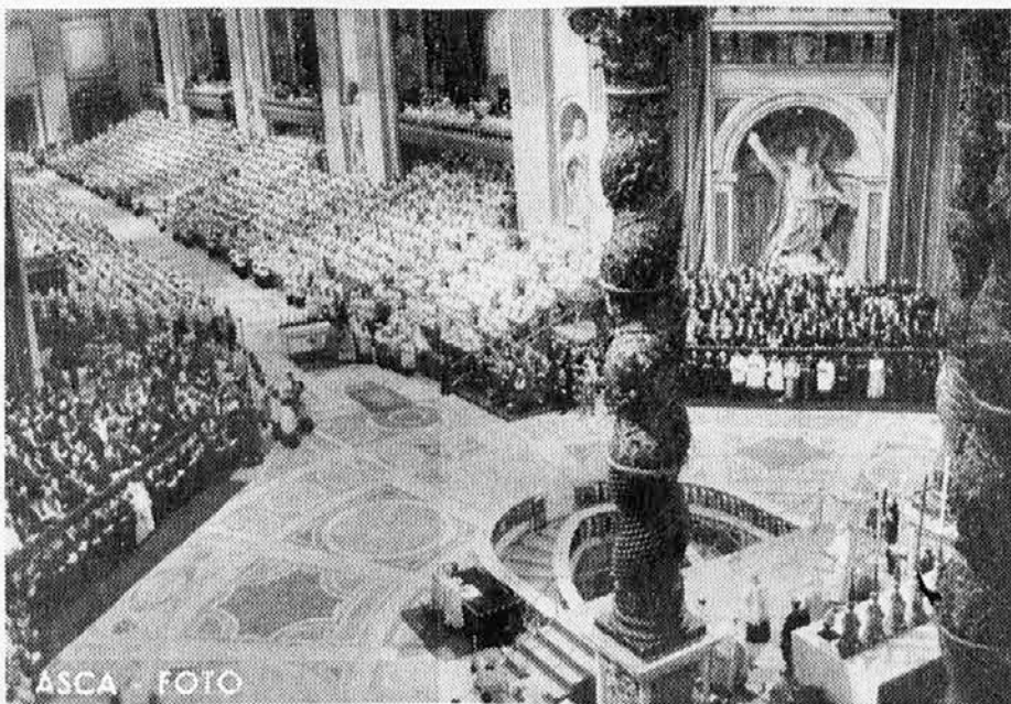
Pred desetimi leti je 12. oktobra papež Janez XXIII. odprl drugi vatikanski cerkveni zbor, ki je nato povzročil v Cerkvi splošno prebujenje, sprožil nove odnose do človeka v današnjem svetu, pa tudi odkril marsikaj nezdravega v naši sredi

Nesreča sovjetskega letala je tako porinila v ozadje drugo letalsko nesrečo leta 1971, ko je na japonskem letalu našlo smrt 162 oseb. Tako ima Sovjetska zveza do nadaljnjega med drugimi pozitivnimi prvenstvi tudi tragičnega. Sovjetska poročevalska agencija Tass je sporočila edino, da je prišlo v petek 13. oktobra do nesreče ob 21.50 po krajevnem času in da ni bilo preživelih. V poročilu ni bilo niti to rečeno, da gre za sovjetsko letalo niti ni bilo povedano, koliko potnikov se je ubilo. Res sojski način poročanja!