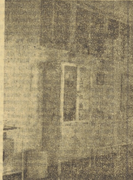
Bolj ko smo pazljivi in skrbni pri delu, bolj smo tudi varni pred nezdami. — Na sliki — prva pomoč ponosrečencu v ambulanti Tovarne avtomobilov v Mariboru

Po statistiki Uprave za socialno zavarovanje je bilo v letu 1950 vseh 25.596 obratnih nezdah. Te nezgode so povzročile v narodnem gospodarstvu 431.388 izgubljenih delovnih dni. Uprava za socialno zavarovanje je morala vsem ponosrečencem oziroma njihovim svajcem izplačati iz naslova branarine, odpravnine, začasne in stalne rente ter invalidnine 141.348.776 dinarjev. To pa je samo ena stran. Če k temu pristojimo še škodo, ki jo je utrpelo naše gospodarstvo neposredno zaradi nezdah (računamo vrednost vsakega izgubljenega delovnega dne po 400 dinarjev), predstavlja ta škoda nadaljnjih 173.555.200 dinarjev, izgubljenih zaslužek pri 431.388 delovnih dneh pa škodo 62.551.260 dni. Celotna škoda za naše gospodarstvo je torej za teh 25.596 nevarnih primerov znašala samo v letu 1950 374.455.236 dinarjev. Iz leta v leto bi se seveda to neprimerno večalo.