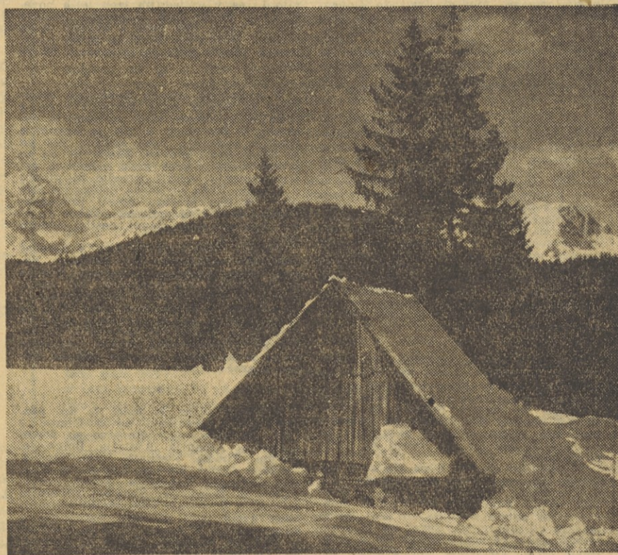
Tudi v zimi je priroda lepa, posebno pri nas v Sloveniji. Snežne planjave naravnost vabijo v goste naše smučarje. Pojdeš tudi ti? — Na sliki: motiv s Poldjuka

In na kraju razprave so člani delavskega sveta Litostroja takole sklenili: z razdelitvijo narodnega dohodka, kakor je to razloženo v družbenem planu, soglašamo. Obljubljamo, da bomo izkoristili vse naše stroje in smo tudi za to, da bodo plače vseh spremenljive, ker bo prav to vsakega navajalo k čim večjemu prizadevanju. Naloge bomo lahko izpolnili le takrat, če bomo utrdili delovno disciplino in zmanjšali odpadke. To pa bo dolžnost vsakogar v našem kolektivu.