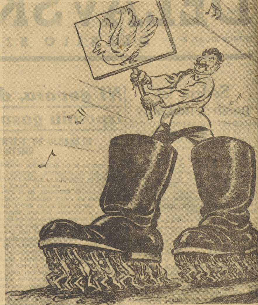
Eej, uhnjem, eej uhnjem...

Naši železniški delavci predlagajo, da bi tudi oni dobili obleke po meri, pa bi kategorijah in številkah, ker bi s tem odpadli nepotrebni stroški za popravila.