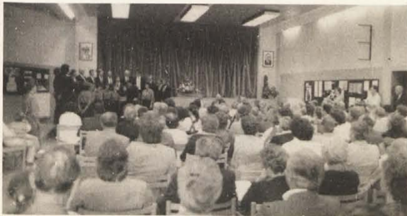
Zveza slovenskih izseljencev je ob svoji 40-letnici prejela Priznanje ZSO