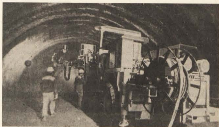
GRADITELJI PREDORA se z modernimi stroji zažirajo v goro