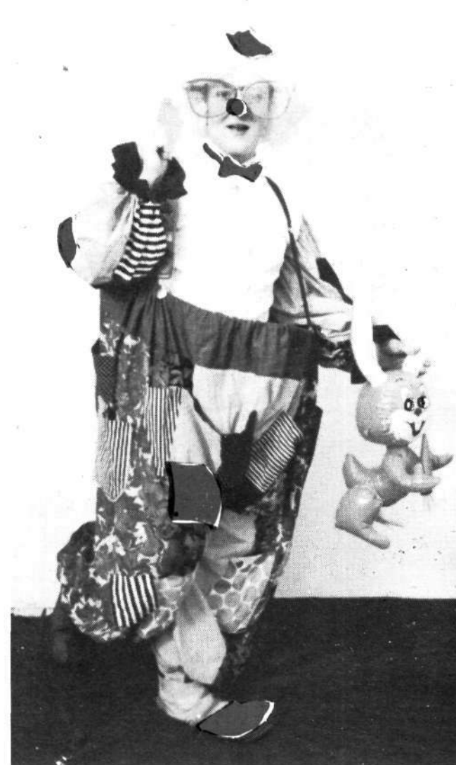
Otroci: izdali vam bomo skrivnost krškega novoletnega sejma. Na njem se bo vse dneve zadrževal tudi čarovnik, rokohitrec, skratka nekdo, ki vas bo kar za sproti in za potrebo znal pozabavati.

Še nekaj Vam lahko zaupamo: po prejemu položnic so se nekateri naši naročniki res odločili, da Našega glasa več ne bodo prejeli. Tisti, ki so nam poslali naročilnice, ga bodo morali tudi plačati, ostali ga pač ne bodo. To je usoda krute poslovnosti. Najbolj pa nas veseli, da je še vedno več novih naročil kakor odpovedi. To pomeni, spoštovani bralci, da smo Vam všeč, predvsem pa to pomeni, da bomo skupaj, torej z Vašo pomočjo, kot se temu reče, zmagali. Naš glas bo pognal korenine, regija Posavje pa bo skupaj z okoliškimi občinami dobila sredstvo množičnega obveščanja, ki se bo borilo za njene interese. (Ika)