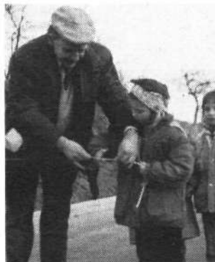
Kakšna priložnost? Odprla sva novo cesto!

V kulturnem programu se je številnim gostom, med kateri-