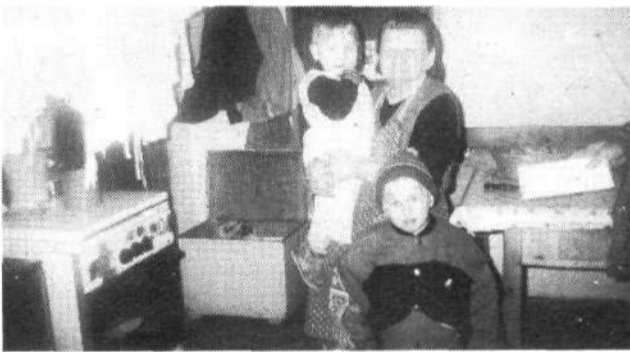
Delta team Krško: