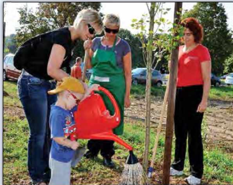
V drevoredu med Murško Soboto in Rakičanom so zasadili mladi topoli