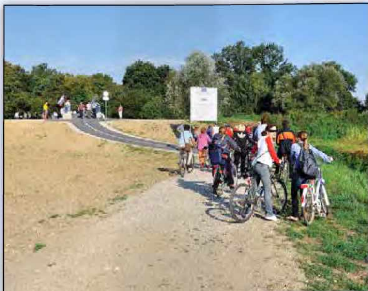
Nov kolesarski most čez Puconski potok