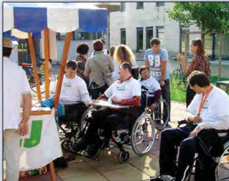
Varna vožnja po mestu z invalidskimi vozički