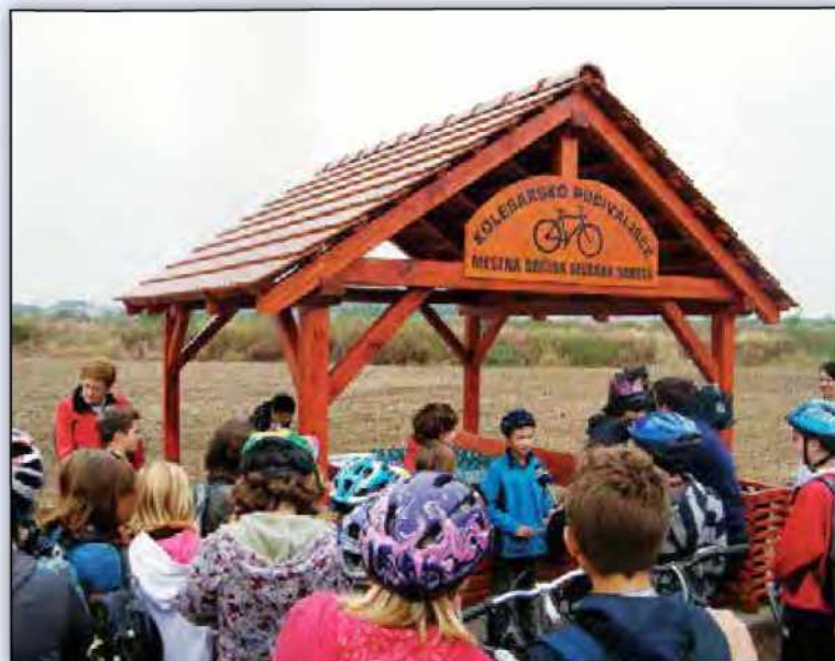
Novo kolesarsko počivališče ob Bakovski cesti