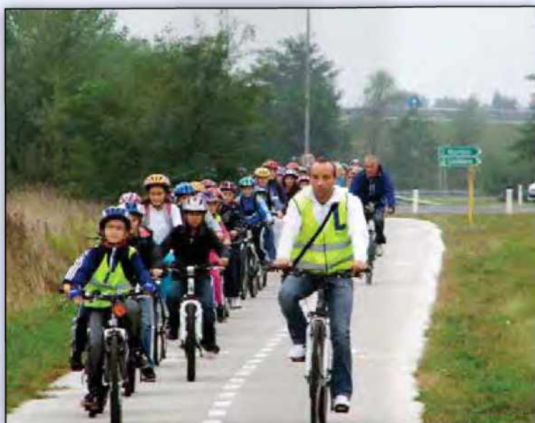
Kolesarji iz osnovnih šol na poti do novega kolesarskega počivališča