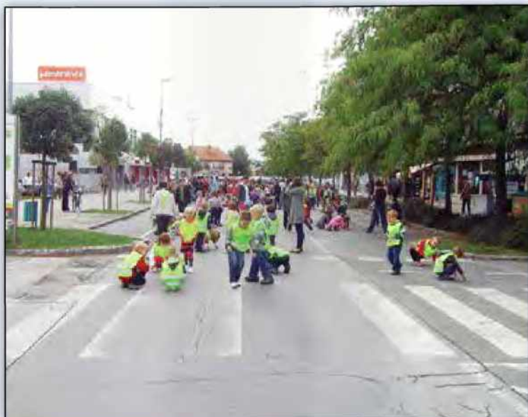
Otroci so zasedli Kocljevo ulico