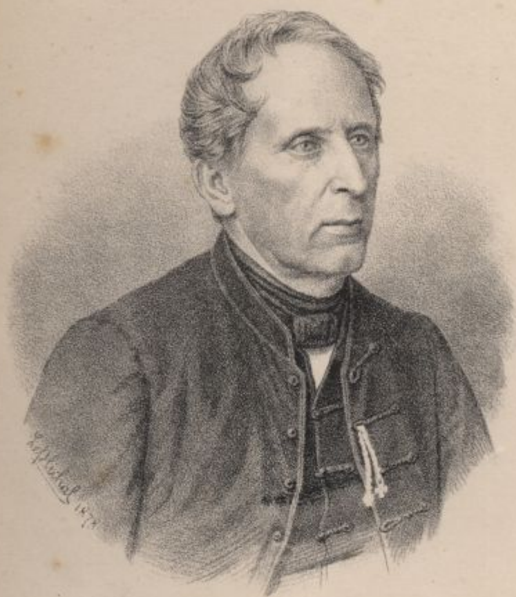
OČE D OR JANEZ BLEIWEIS O SEDEMDESETLETNICI SVOJI DNE 19 NOVEMBRA LETA 1878.