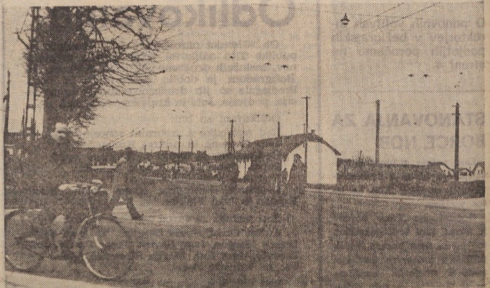
KRIZISČE TOLSTOJEVE ULICE — Prehod za pešce ni označen.

Je že tako, da ponavadi ukrepamo šele takrat, ko se nesreča že zgodi. To velja tudi za prometne razmere. Na Titovi cesti, ali natančneje, na odseku štajerske magistrale od Lampiča do prodajalne »Kuriva« v Stožicah, se je pripetilo že veliko nesreč, katerih žrtve so bili največkrat pešci. Ne moremo trditi, da smo na tem odseku dovolj storili za varnost prometa. Nedavno tega se je na tem odseku smrtno ponesrečil pešec. Prislunhili smo množični prebivalce, ki se je zbrala na kraju tragičnega dogodka: