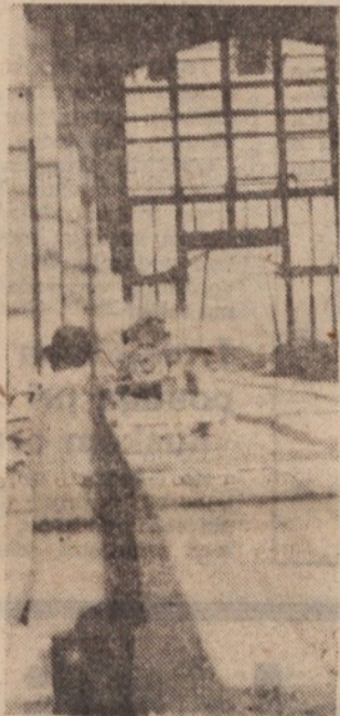
Nova dvorana tovarne »Energoinvest« na Črnučah.

Vsega se ne da naučiti v eni noči. Pa tudi ni treba. V Energoinvestu se ne ozirajo nazaj, marveč natančno načrtujejo že vse za jutri. Delavci, ki bodo opravljali velike nove in zahtevne stroje, se že sedaj učijo na teh strojih v inozemstvu, delavci, ki bodo stroje vzdrževali, jih bodo pomagalj tudi montirati. Ko bo vrvice na vratih nove tovarniške dvorane v Črnučah prerezana, ne bo potrebno iskati strokovnjakov in narediti nekaj škode za poskušnjo. Čeprav se pri nas to čisto zgodi, da se učimo na nepakah (in še zelo počasi) se to tokrat v Energoinvestu ne bo zgodilo. Ker pač vedo, kako stvari gredo.