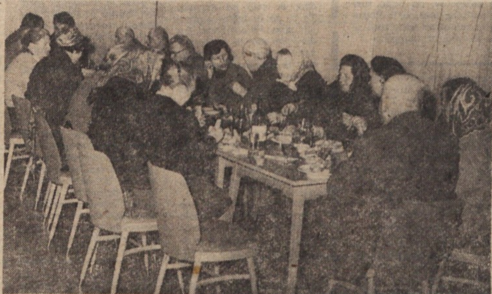
PRIJATELJSKO SREČANJE — Organizacija ZB na Ježici je gostila nekdanje borce in aktiviste ter starše padlih partizanov.

belja 32 članom preventivno zdravljenje, 21 članom ZB pa je bilo na zdravljenju v zdraviliščih. To so podatki, ki kažejo odbornike in aktivne člane ZB na Ježici in Stožicah v lepi luči.