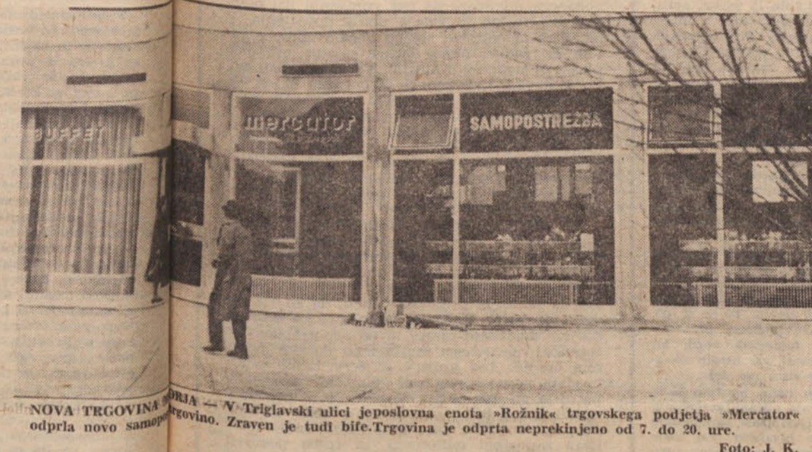
NOVA TRGOVINA — V Triglavski ulici je poslovna enota »Rožnik« trgovskega podjetja »Mercator« odprla novo samopostrežno trgovino. Zraven je tudi bife.Trgovina je odprta neprekinjeno od 7. do 20. ure.

Za vsa zemljišča, ki kmetje dajejo v zakup ali so arondirana, na občini pišejo prispevke od dohodka iz kmetijske dejavnosti, ki dobi ustrezen postoj odzroma odloče za vsa potrebni podatki. Če se zavezanec meni, da tega urejenega, naj se zgleda na seku za dohodki, na kateri kjer mu bodo vse polje-