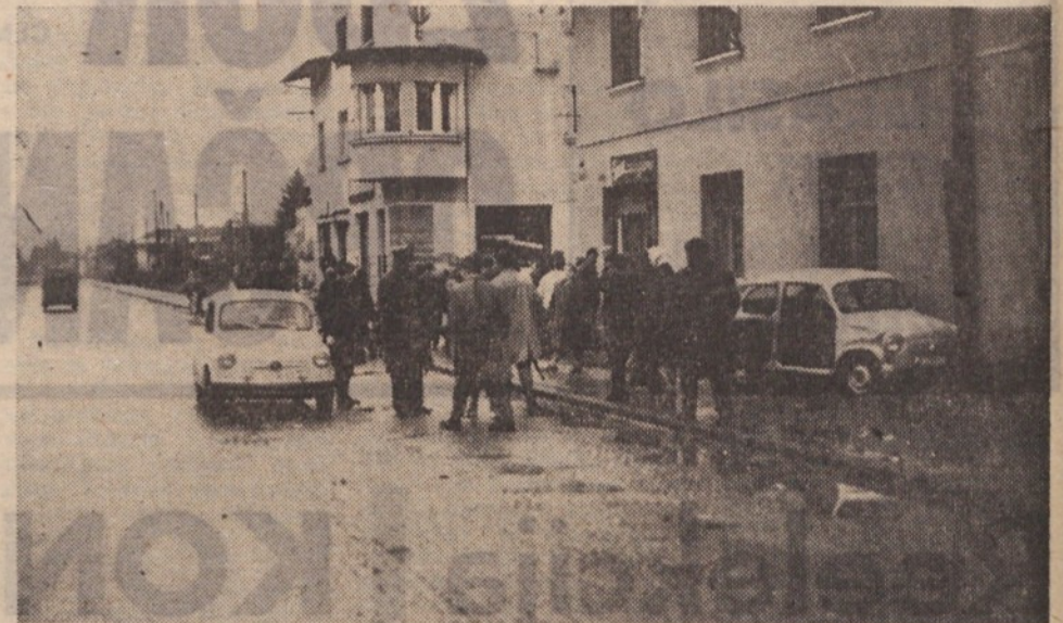
TOKRAT LE ZVITA PLOČEVINA — Na križišču Zupanove ulice in Titove ceste se je pripetilo že precej nesreč.

Za varnost prometa na Titovi cesti v Stožicah bi morali več storiti