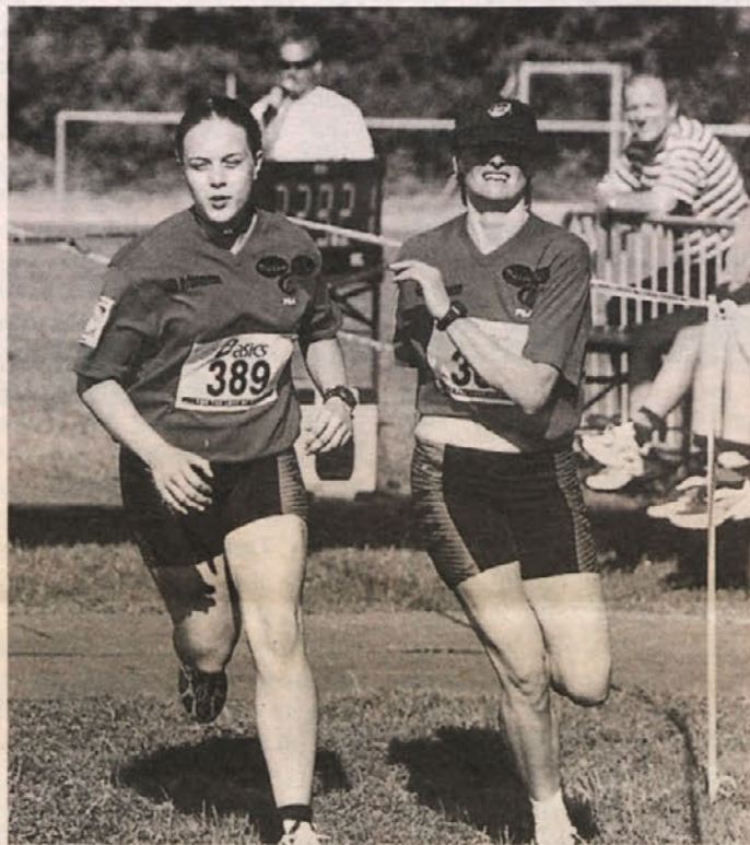
Polmaratona se bo udeležilo tudi mnogo žensk