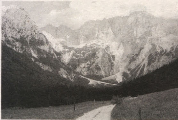
Pogled na Ravensko Kočno

Člani društva Coppla kaša imajo ob cesti postavljene enotne lesene informacijske table, ki vabijo k obisku ter nakupu domačih proizvodov, ki so znani po svoji kakovosti. Nekaj metrov za kmetijo Pop smo nato zapustilo cesto in zavili na levo navkreber v gozd, kjer smo nadaljevali hojo po gozdni poti do kmetije Avprih. Od tam naprej se je hoja nadaljevala po makadamski cesti do kmetije in gostilne Raztočnik. Markirana pot se tu nadaljuje proti Lužam, ki pelje do kmetije Kukež. Pod to kmetijo smo krenili na desno po gozdni cesti navzgor, ki pripelje blizu državne meje do Kukeževega vrha. Tam se prid-