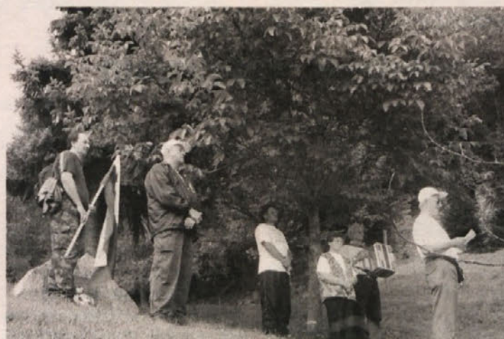
S pohoda Koroškega bataljona ...

borišču Dachau in za posledicami kasneje umrli, n je pohodna karavana podoživela vojne dni. Okrepčani in očarani z razgledom na bližnje gore in doline smo pot nadaljevali po gozdu. Pričele so se stranpote gobarjev, saj tej strasti težko ubežiš.