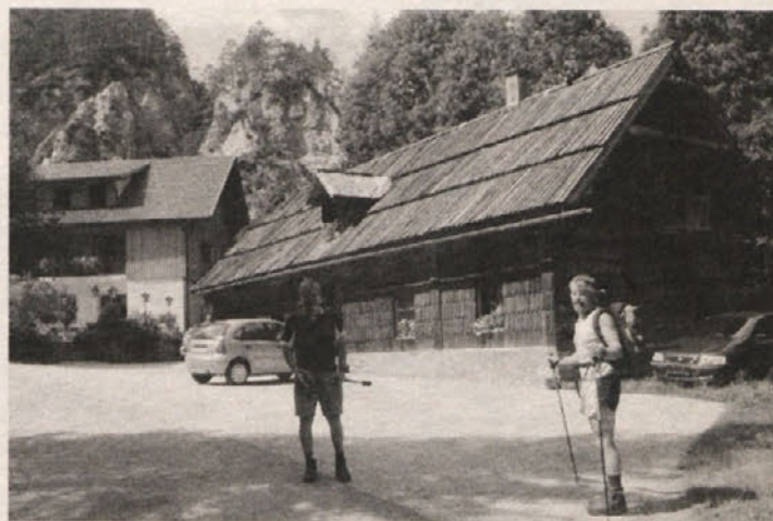
Pri Franclnu v Kortah