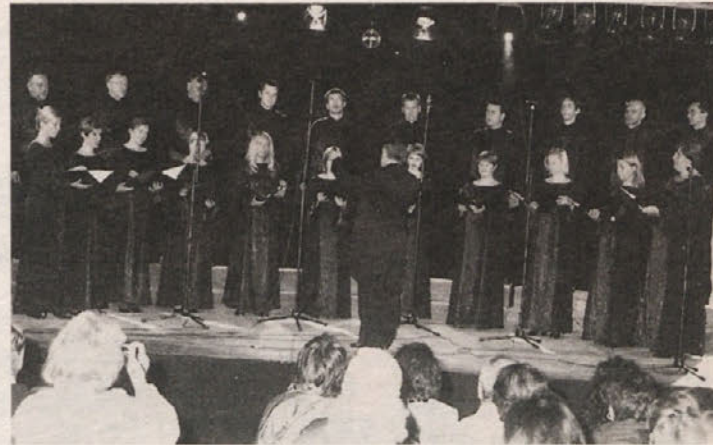
Mojstrski zbor Ljubljanskih madrigalistov