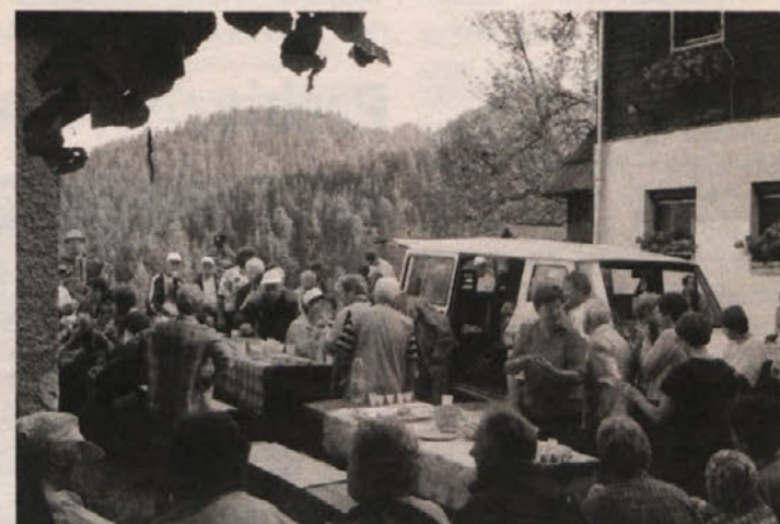
... in ob družabnosti