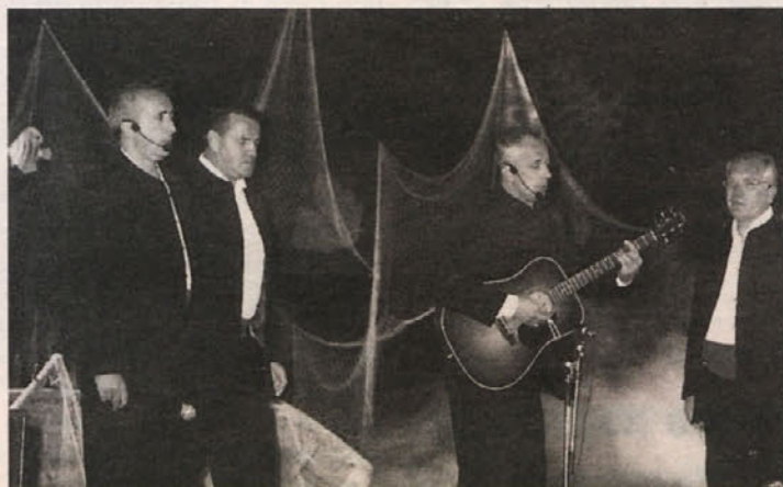
Splitska klapa »More« je prinesla dah Jadrana

Zaključek in koncertni višek open aira pa je bil »zborovski festival« v nedeljo, 18. avgusta. Ta večer je bil obenem most do tridesetletnice obstoja, ki jo bo Moški pevski zbor »Trta« slavil letos decembra s koncertoma v pliberškem Kulturnem domu in v žitrajšem KUMST-u.