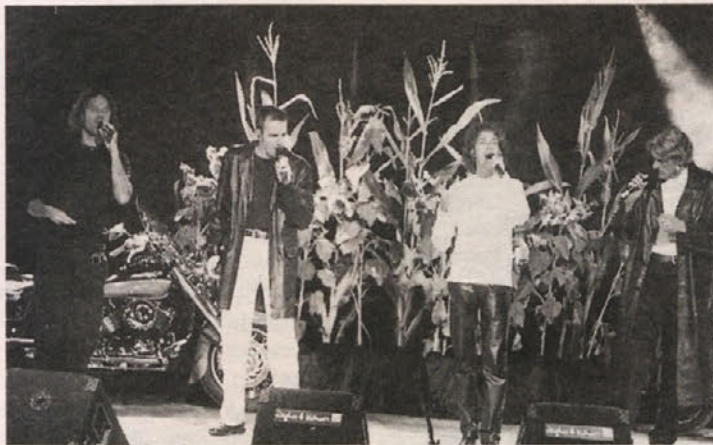
Rock4 so z glasom in gibom navdušili občinstvo

Sobota, 17. avgusta, je bila namenjena nizozemski skupini »Rock4«, ki je, prikrojeno na rokovski način, pela šansone, popevke in druge glasbene uspešnice. Mislim, da tega pevskega žanra na tako visoki ravni pri nas ne bomo spet doživeli tako kmalu. Jasno, da je občinstvo do zadnjega napolnilo prireditveni prostor. Nizozemski kvartet ni blestel le na odru, ampak se je tudi v osebnem pogovoru izkazal kot sila simpatična in razgledana skupina, ki jo je docela prevzel ambient farovškega dvorišča.