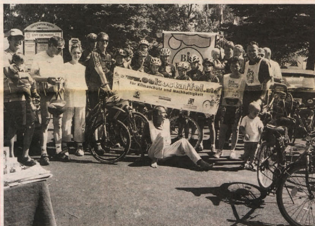
Ekološka štafeta, ki te dni teče po vsej Avstriji, je v soboto bila v občini Dobrla vas, Globasnica in Bistrica, ki so članice Klimatske zveze. Štafeta je nadaljevala v občino Suha in od tam v občino Dravograd v Sloveniji.