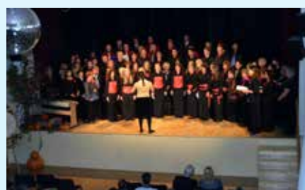
Zduženi zbori ob skupnih pesmih