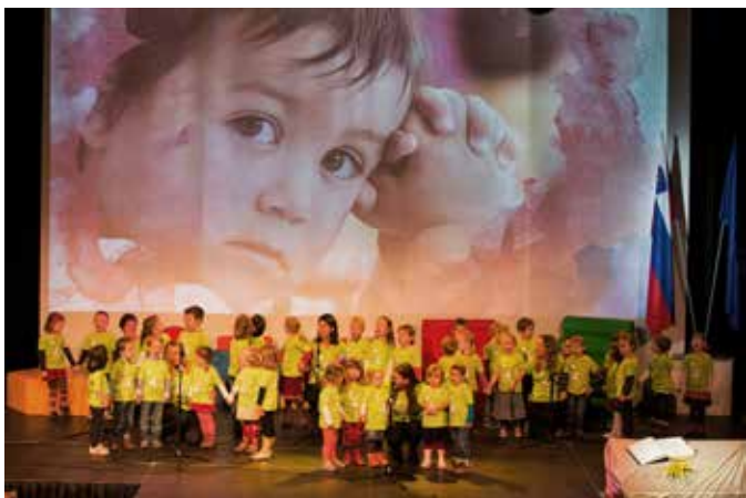
Slovesna akademija ob praznovanju zavetnika Zavoda sv. Stanislava

Mesec november je v Zavodu sv. Stanislava že tradicionalno zaznamovan s praznovanjem godu hišnega zavetnika sv. Stanislava. Vsaka od šestih enot oblikuje praznični program na svoj način. Letos je bilo še posebno prisrčno v najmlajši enoti, Vrtcu Dobrega pastirja, ki je v novih prostorih začel delovati letošnjo jesen. Gotovo pa je bil najslavesnejši dan prav 13. november, ko goduje sv. Stanislav. Letos smo se na ta dan še posebej spomnili treh dogodkov, ki so letošnje šolsko leto posebej zaznamovali: ustanovitev nove enote Vrtca Dobrega pastirja, odprtje novih prostorov Osnovne šole Alojzija Šuštarja in 20. obletnica delovanja Jegličevega dijaškega doma.