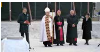
Položitev temeljnega kamna za osnovno šolo in vrtec