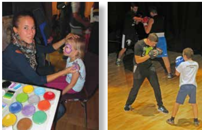
Arhiv: ČS Šentvid

bučen konec odrskih nastopov in vodenega programa je z enournim koncertom poskrbel Pihalni orkester Litostroj, ki je s svojim pestrim repertoarjem, od klasike do modernih skladb in koračnic, oživel publiko in dodal piko na i Jesenskemu srečanju.