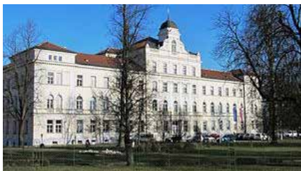
Palaca zavoda v Šentvidu, zgrajena 1905

V njej je takoj začela delovati prva slovenska klasična gimnazija, pred dobrim letom je bila 110. obletnica prve mature v slovenskem jeziku. V 30. letih je to gimnazijo obiskoval tudi ljubljanski nadškof Alojzij Šuštar. Gimnazija je v Škofovih zavodih delovala do 2. svetovne vojne, ko so stavbo zasedli Nemci. Po koncu vojne je bila v njej vojašnica JLA, ki je stavbo zapustila leta 1991. Po osamosvojitvi leta 1991 je Cerkev stavbo dobila nazaj in že leta 1993 je v Zavodu spet začela delovati Škofijska klasična gimnazija, 28. novembra 1994 pa je bila v njem ustanovljena radijska postaja RADIO OGNJIŠČE.