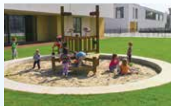
Otroci na zunanem igrišču