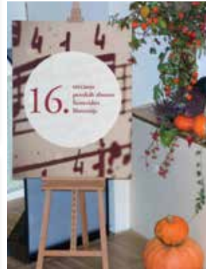
16. srečanje pevskih zborov Šentvidov Slovenije

Kaj imajo skupnega Ljubljana, Grobelno, Lukovica, Stična in Planina? To, da je v bližini vsakega izmed teh krajev Šentvid. Če morda še ne veste, lahko v Sloveniji in njeni bližnji okolici najdemo več kot osem različnih Šentvidov, v vsaj petih pa delujejo tudi različni pevski zbori, ki se vsako leto srečajo v enem izmed Šentvidov in oblikujejo lep, kulturno obarvan večer.