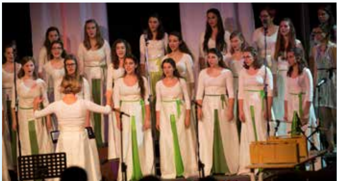
Slovesna akademija ob praznovanju zavetnika Zavoda sv. Stanislava

Osrednja dogodka tega dne sta bila maša v župnijski cerkvi sv. Vida in akademija v Zavodu sv. Stanislava. Številni gostje so bili povabljeni, da »stopijo narahlo /.../ naravnost pri glavnih vratih v ta lepi dan«, s čimer so jih nastopajoči učenci na akademiji popeljali v večerno praznovanje, ki je povzelo delovno vnemo in ustvarjalni utrip v naši hiši. V skladu s poslanstvom Zavoda sv. Stanislava je bilo ta večer poudarjeno predvsem dejstvo, da človek, še posebno mlad, raste, resnično živi in pušča sled tam, kjer je iztrgan iz osamljenosti in vključen v skupnost. V tem smislu so bili v program vpleteni tudi najpomembnejši vsebinski poudarki novo oblikovanih vzgojnih načel in etičnega kodeksa, ki usmerjajo delovanje učiteljev. Vzgoja v razredni skupnosti je vedno dialog med učiteljem in učencem, pri katerem morata drug drugega sprejemati in modro upoštevati enkratnost posameznika. Praznični dan je izzvenel predvsem v zahvali za sledi, ki jih puščajo vse enote v Zavodu sv. Stanislava v mladih, njihovih družinah, naši družbi in Cerkvi na Slovenskem.