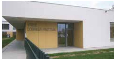
Vrtec Dobrega pastirja

Osnovna šola Alojzija Šuštarja je edina katoliška osnovna šola v Sloveniji. Poleg obveznih predmetov, ki jih izvajajo vse javne šole, so na tej šoli še naslednji predmeti: spoznavanje vere na razredni stopnji in vera in kultura na predmetni stopnji ter klasična kultura z latinščino in praktikum. Na šoli si prizadevajo, da bi vsak otrok razvil svoje sposobnosti in darove, s katerimi je obdarjen, v največji možni meri. Vzgojni koncept je utemeljen na vzgoji v poštene, strpne, odgovorne in solidarne državljanke, da bi imeli vrednote spoštovanja drugače mislečih, vzgoje in odgovornosti do naravnega okolja, narave kot Božjega stvarstva.