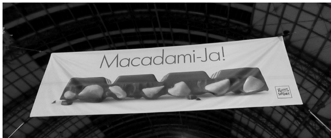
Abb. 9: Kreativität in Typographie: Werbung

mit Elementen der griechischen Schrift, die beim Leser bestimmte Assoziationen in Bezug auf Griechenland (und griechisches Essen) auslösten (vgl. Janich 2013: 249). Weitere typographische Mittel, anhand welcher in Texten kreativ gehandelt werden kann, sind intendierte Verwendung von Groß- oder Kleinbuchstaben, graphische Segmentierung, Fettdruck usw. So wird in der Ritter Sport-Werbung, die mit einer Homophonie für die Schokolade mit Macadamia wirbt (vgl. Abb. 9), das Wort Macadamia nicht nur anders (mit einem „J“) geschrieben, sondern auch graphisch segmentiert. Die beabsichtigte Schreibung mit Bindestrich ( Macadami-Ja! ) weist also noch zusätzlich auf die Doppeldeutigkeit der Werbung hin; die Schlagzeile kann etwa folgendermaßen paraphrasiert werden: „Sag ‚Ja!‘ zu der Schokolade mit Macadamia“. 7