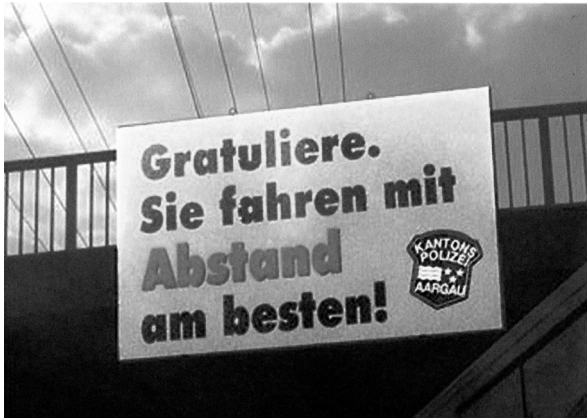
Abb. 4: Hinweistafel Sie fahren mit Abstand am besten!

Um den Leser durch Abweichung vom Gewohnten zu überraschen und ihn dadurch zum Nach- und Weiterdenken zu verleiten, werden in Texten oft auch rhetorische Figuren verwendet. So werden im folgenden Post auf der Facebook-Seite des Stadttheaters Gießen, in dem die Theatervorstellung Die Affäre Rue de Lourcine angekündigt wird, mehrere rhetorische Fragen benutzt: