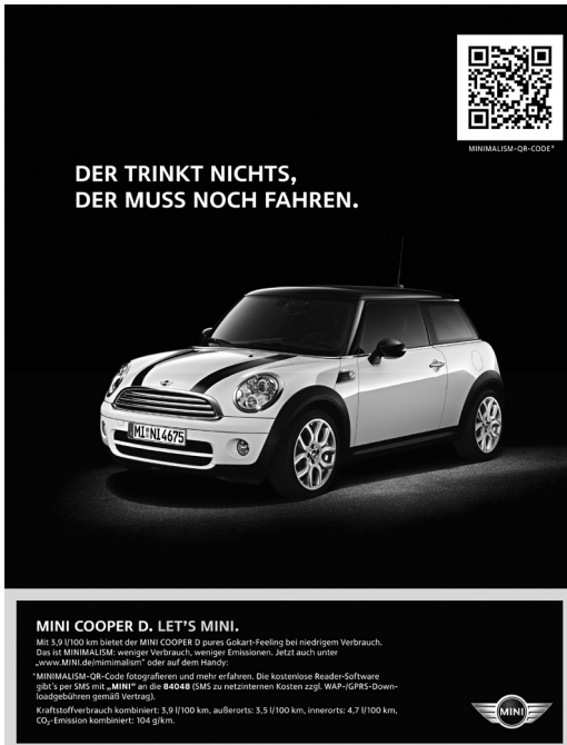
Abb. 8: Kreativität in Text und Bild: Werbung

Darüber hinaus kann das Kreativitätsprinzip im Bereich des Visuellen zum Ausdruck kommen, indem der sprachliche Teil des Textes (z. B. ein Wort oder eine Silbe) durch ein Bild, eine Zahl oder ein anderes nicht-sprachliches Symbol ersetzt wird, wie etwa in Isam (für einsam ), 2felsfrei (für zweifelsfrei ), ***himmel (für Sternenhimmel ) oder ♥lich (für herzlich ; vgl. auch Abb. 10). Solche Kombinationen von sprachlichen und nicht-sprachlichen Zeichen kommen oft in Texten mit aufmerksamkeitsregender Funktion, vor allem aber in medienbedingten Sms- und Chat-Schreiben vor. In letzteren ist der Gebrauch von nicht-sprachlichen Zeichen unter anderem durch den beschränkten Zeichenvorrat, die umständliche Tastatureingabe und den Unterhaltungscharakter motiviert.