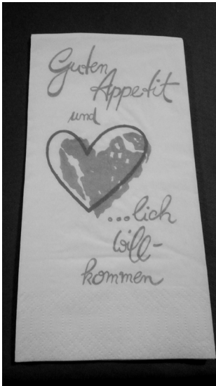
Abb. 10: Kreatives Medienformat: Serviette

Dies kann im Bereich der Medialität erfolgen, indem in einem Kommunikationsangebot z. B. verschiedene Medien gemischt werden oder indem ein gewisser Text durch ein Medienformat vermittelt wird, auf welchem wir diesen Text normalerweise nicht erwarten. So wünscht das Gießener Restaurant Aspendos seinen Gästen auf einem ungewöhnlichen Textträger 8 , einer Serviette, einen guten Appetit und heißt sie herzlich willkommen (vgl. Abb. 10). Dabei trägt zu dem Originalitätsprinzip zusätzlich noch das Bild des Herzens bei, das die Silbe herz in herzlich ersetzt. Weitere Beispiele für innovative Nutzung von Medienformaten im Gastronomie-Bereich sind Speisekarten, die etwa auf Schallplatten oder in Formularform (zum Ausfüllen und Ankreuzen) abgedruckt sind oder Informationen zu den einzelnen Speisen sogar auf einem Tablet (mit interaktiven Möglichkeiten) liefern. 9