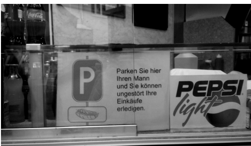
Abb. 14: Hinweisschild Parken Sie hier Ihren Mann...

Die zweite Möglichkeit, wie man im Bereich der Lokalität abweichen kann, ist durch die Stellung eines Textes (z. B. eines Orts- oder Straßenschildes, eines Verkehrszeichens usw.) an einen anderen Ort. Während Schilder mit einem weißen „P“ auf blauer Unterlage normalerweise Parkplätze bezeichnen, sorgt ein solches Schild an einem Getränkestand, mit dem Zusatztext Parken Sie hier Ihren Mann und Sie können ungestört Ihre Einkäufe erledigen (vgl. Abb. 14), für die Unterhaltung der Passanten in einer Einkaufsmeile.