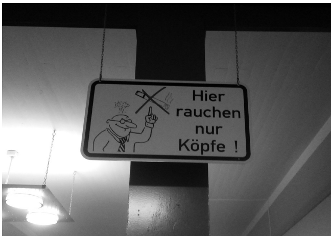
Abb. 3: Verbotsschild Hier rauchen nur Köpfe!

Ein ähnliches Beispiel, in dem mit der wörtlichen und übertragenen Bedeutung des Wortes rauchen gespielt wird, ist an mehreren Wänden der Universität Gießen zu finden: Hier rauchen nur Köpfe! (vgl. Abb. 3). Der übliche direkte Hinweis „Rauchen verboten“ wird hier durch eine originelle Alternative ersetzt, in welcher eine Variation des Phraseologismus „jemandem raucht der Kopf“ verwendet wird, was so etwas wie ‚jemand denkt angestrengt über etwas nach‘ (vgl. Duden Online) bedeutet. Studierende (und Mitarbeitende) werden also auf eine kreative Art und Weise auf das Rauchverbot in den Räumen der Universität hingewiesen – es kommt eine sogenannte Frame-Verschiebung vor (vom Frame „Rauchen“ auf den Frame „Universität“ bzw. „Studieren“), denn die bereits konstruierte lexikalische Bedeutung von „rauchen“ wird auf der Basis weiterer Informationen („hier wird studiert“) rekonzeptualisiert (vgl. Ziem 2012: 74). Dabei wird die Verschiebung auf den zweiten, intendiert ausgewählten Frame durch das Hintergrundwissen der Rezipierenden (darüber, dass hier gelernt wird) motiviert; die zu verstehende Bedeutung wird außerdem durch das Bild eines Mannes, dem „der Kopf raucht“, und zusätzlich noch durch das Bild einer durchgestrichenen Zigarette unterstützt. An diesem Beispiel wird deutlich, dass die sprachliche Kreativität in Texten und Kommunikationsangeboten auch anhand phraseologischer Verfahren realisiert werden kann.