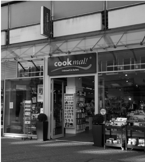
Abb. 1: Ladenname cook mal!

Das Kommunikationsprinzip der sprachlichen Kreativität in Texten kann ferner auf der lexikalischen Ebene und der Ebene der Wortbildung umgesetzt werden. Dies erfolgt z. B. anhand von Wort- oder Silbenvertauschung, -hinzufügung oder -ersetzung, anhand von Wiederholungen, Polysemen, Neubildungen und Okkasionalismen, anhand von fremdsprachlichem Material usw. Während zu Wortersetzungen und dem Gebrauch von fremdsprachlichem Material das oben analysierte Beispiel cook mal! gehört, denn das deutsche Wort guck wird hier durch das englische cook ersetzt, ist ein gutes Beispiel mit Polysemie in der folgenden Werbeschlagzeile für Zigaretten Lucky Strike zu finden: Hier können Sie gleich einen Zug nehmen (vgl. Abb. 2). Das Sprachspiel in dieser Schlagzeile basiert auf der Doppeldeutigkeit des Lexems „Zug“ – dieses wird einmal als Verkehrsmittel und einmal als ‚das Einziehen von Rauch‘ (vgl. Duden Online) verstanden. Das doppeldeutige Sprachspiel ist an die Situation des Werbetextes gut angepasst, denn das Plakat befindet sich über einem Tabak-Shop am Gießener Bahnhof.