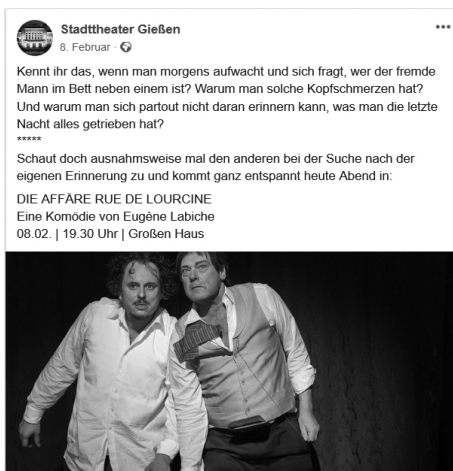
Abb. 5: Facebook-Ankündigung Die Affäre...

Kennt ihr das, wenn man morgens aufwacht und sich fragt, wer der fremde Mann im Bett neben einem ist? Warum man solche Kopfschmerzen hat? Und warum man sich partout nicht daran erinnern kann, was man die letzte Nacht alles getrieben hat? [...] Schaut doch ausnahmsweise mal den anderen bei der Suche nach der eigenen Erinnerung zu und kommt ganz entspannt heute Abend in DIE AFFÄRE RUE DE LOURCINE [...] (Abb. 5).