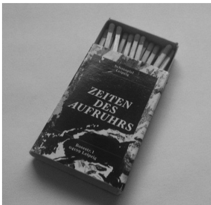
Abb. 12: Kreatives Medienformat: Streichholzschachtel