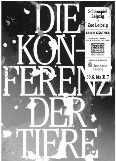
Abb. 11: Kreatives Medienformat: Postkarte

Ein weiterer Bereich, in dem aufgrund des ständigen Bestrebens nach Originalität und Auffälligkeit mit ungewöhnlichen Medienformaten „gespielt“ wird, ist der Bereich der Werbung. Während Werbetexte in der Regel in Form von Werbeanzeigen in Zeitungen, Zeitschriften oder im Internet, Werbespots im Fernsehen oder online, Werbeplakaten auf Plakatwänden oder Werbeflyern vorhanden sind, wirbt beispielsweise das Schauspiel Leipzig für seine Theaterstücke unter anderem auf eine ganz innovative Art und Weise. So wird für viele Vorstellungen auf Postkarten geworben (vgl. Abb. 11), und die Werbung für die Spielzeit 2014/15 mit dem Motto Zeiten des Aufbruchs befand sich sogar auf einer Streichholzschachtel und erzielte somit einen witzigen bzw. überraschenden Effekt (vgl. Abb. 12).