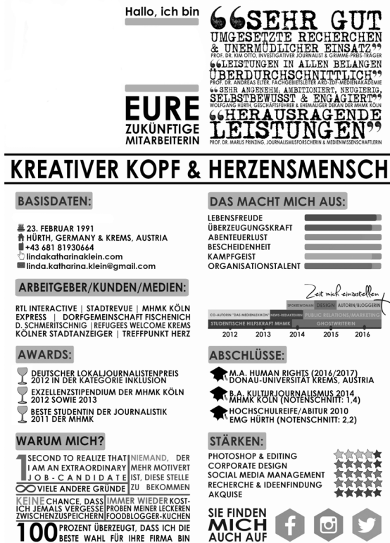
Abb. 7: Kreatives Layout: Lebenslauf

Pfeife 5 ). Hierbei stehen der sprachliche und der bildliche Teil in einer Relation der Kontradiktion; es handelt sich um eine bewusst eingesetzte Abweichung, die der Demonstration von Originalität und Unterhaltsamkeit dient und einen witzigen Effekt zum Ziel hat. Des Weiteren können Bilder in abweichenden Texten zum Verstehen des sprachlichen Teils verhelfen (vgl. Abb. 3), manchmal ergeben sich Sprachspiele sogar erst durch den Zusammenhang von Text und Bild. So entsteht die sprachliche Mehrdeutigkeit in der Werbeschlagzeile Der trinkt nichts, der muss noch fahren (vgl. Abb. 8) aufgrund des Bildes des Autos Mini Cooper – dieses ermöglicht nämlich die zweite, zu entschlüsselnde Bedeutung der Schlagzeile vom niedrigen Benzinverbrauch. Der Leser muss die Pointe der Werbeschlagzeile aus Kombination der beiden bedeutungstragenden Modalitäten erst entschlüsseln, was im optimalen Fall zu einem „Aha!-Effekt“ führt. Hier zeigt sich, dass aufgrund der spielerisch genutzten, durch Bilder bedingten Mehrdeutigkeit solchen Texten auch eine erkenntnisgenerierende Funktion zukommt. 5