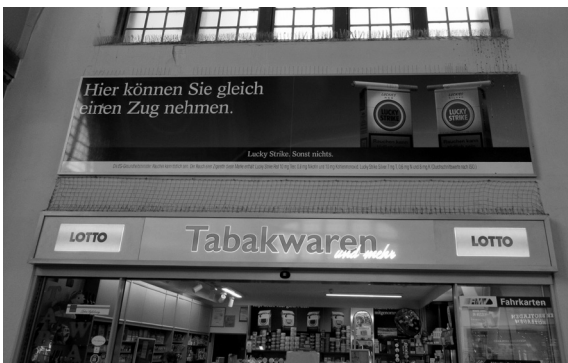
Abb. 2: Werbeschlagzeile Hier können Sie gleich einen Zug nehmen

Das Kommunikationsprinzip der sprachlichen Kreativität in Texten kann ferner auf der lexikalischen Ebene und der Ebene der Wortbildung umgesetzt werden. Dies erfolgt z. B. anhand von Wort- oder Silbenvertauschung, -hinzufügung oder -ersetzung, anhand von Wiederholungen, Polysemen, Neubildungen und Okkasionalismen, anhand von fremdsprachlichem Material usw. Während zu Wortersetzungen und dem Gebrauch von fremdsprachlichem Material das oben analysierte Beispiel cook mal! gehört, denn das deutsche Wort guck wird hier durch das englische cook ersetzt, ist ein gutes Beispiel mit Polysemie in der folgenden Werbeschlagzeile für Zigaretten Lucky Strike zu finden: Hier können Sie gleich einen Zug nehmen (vgl. Abb. 2). Das Sprachspiel in dieser Schlagzeile basiert auf der Doppeldeutigkeit des Lexems „Zug“ – dieses wird einmal als Verkehrsmittel und einmal als ‚das Einziehen von Rauch‘ (vgl. Duden Online) verstanden. Das doppeldeutige Sprachspiel ist an die Situation des Werbetextes gut angepasst, denn das Plakat befindet sich über einem Tabak-Shop am Gießener Bahnhof.