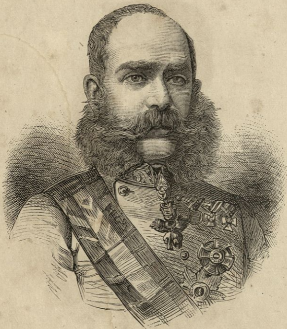
Cesar Franc Jožef I.