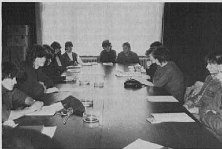
Pripravniki so se seznanili tudi z delom mladinske organizacije

Razgovor je vodil Nejko Podobnik, zapiske je pripravila Anuška Kavčič.