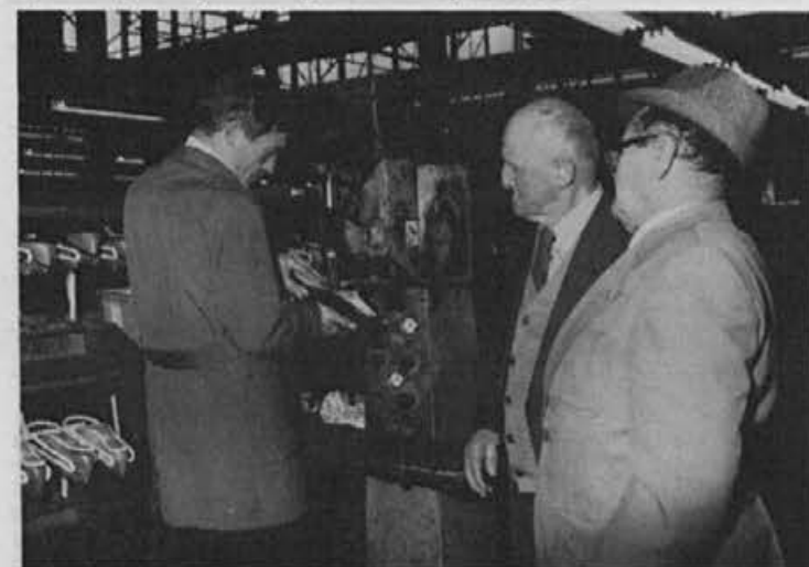
Zanimivo je videti, kako delavci delajo danes

— Informator bomo izdajali 1—2 krat tedensko, s tem, da bomo izboljšali njegovo obliko in tudi vsebinski koncept (rubrike).