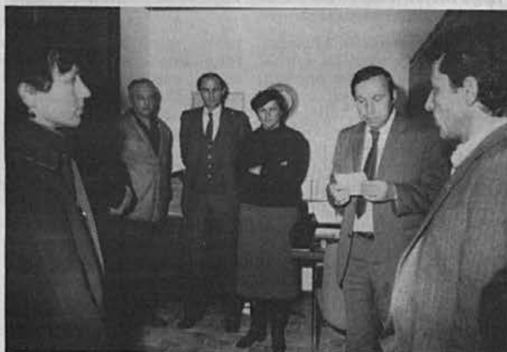
Ljubljanska banka — ekspozitura Žiri je začela z delom v novih prostorih. Slika je z otvoritve prostorov