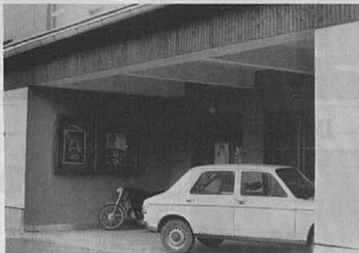
Obnova prostorov DPD Svoboda Žiri se je začela z vhodom