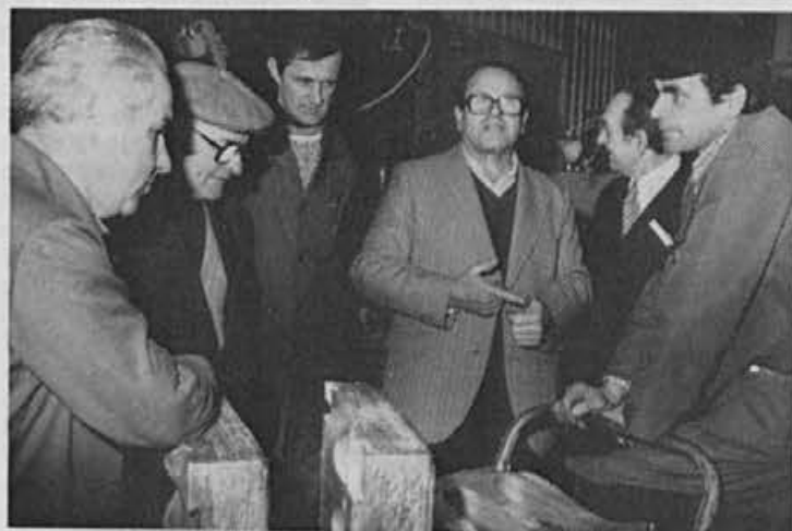
Napredek v orodjarni je ogromen