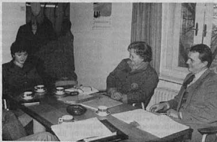
S strokovnega izpita pripravnikov

Tekst: Nejkó Podobnik