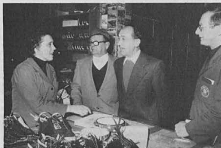
Takrat je bilo vse drugače ...