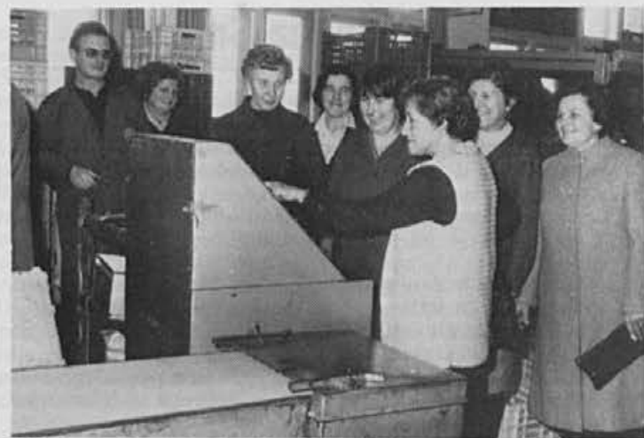
Nekdanje in sedanje delavke v živahnem pomenku