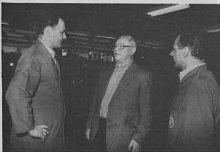
V oddelku nekdanj in danes