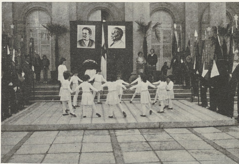
Ritmična skupina osnovne šole "Boris Kidrič" Rogaška Slatina