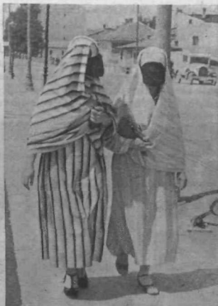
Muslimanki na sprehodu

Krenem skozi nekdanja mestna vrata, ki so danes samo še majhen