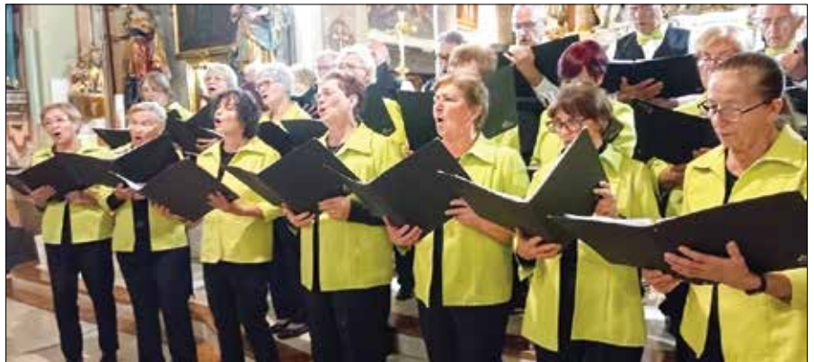
Pevci in pevke so oblekli praznja oblačila in zapeli v farni cerkvi sv. Jurija v Mozirju.