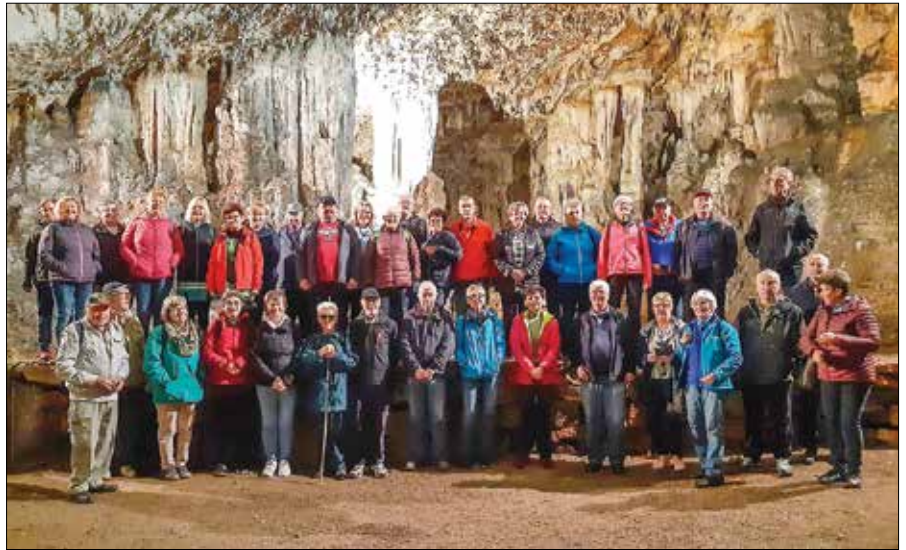
Jama Vilenica je s svojimi lepotami prevzela izletnike iz Gornje Grada.