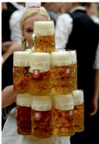
Natakarice? Ne spomnim se, da bi na Oktoberfestu videl kake natakarice ...

Hrvati bodo z novim letom šli s kun na evre. Kaj ko bi tudi mi šli na kako močnejšo valuto?