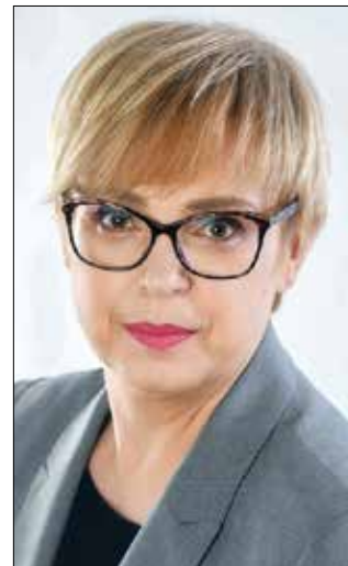
V drugem krogu predsedniških volitev 13. novembra se bosta pomerila Anže Logar in Nataša Pirc Musar

največ podpore dobil v Podvolovljeku, kjer je zanj glasovalo 74 odstotkov volivcev. 73-odstotno podporo so mu izrekli na Dobrovljah pri Mozirju, 71-odstotno v Šmihelu nad Mozirjem in 70-odstotno