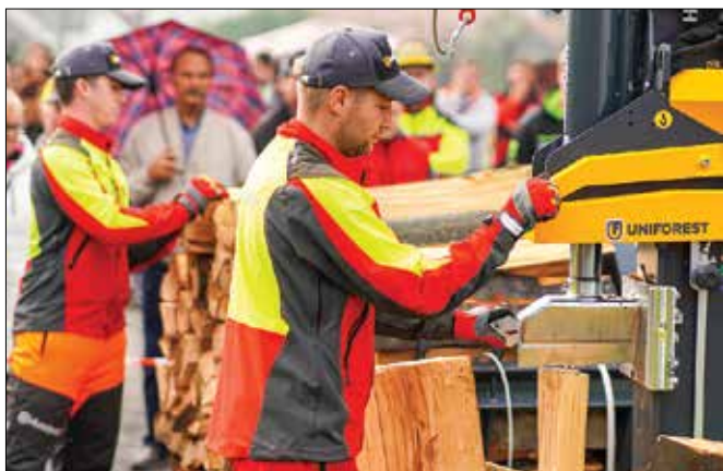
Obiskovalci so si lahko ogledali prikaz delovanja strojev Uniforest.

Franci Kotnik, foto: arhiv podjetja Uniforest