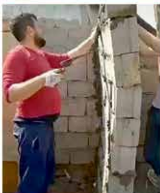
Drži, da poračunam!

Eskadrilj vinskih mušic prav nič ne moti, da iz mošta še ni nastalo vino.