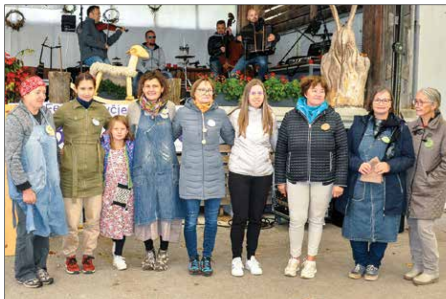
Članice Društva solčavskih filcark Bicka so v 17 letih delovanja naredile pomemben premik pri promociji avtohtone jezersko-solčavske ovce in njene volne.