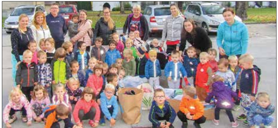
Zbrana oblačila, obutev in igrače, ki so ostale po izmenjavi, smo odpeljali na Rdeči križ.