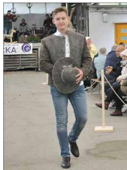
Modna revija v okviru 12. Festivala ovčje volne Bicka je postregla z bogato paleto polstenih in volnenih oblačil v kombinaciji z drugimi naravnimi materiali.