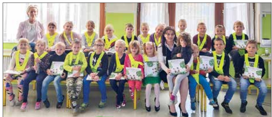
Učenci 1. a razreda Osnovne šole Nazarje