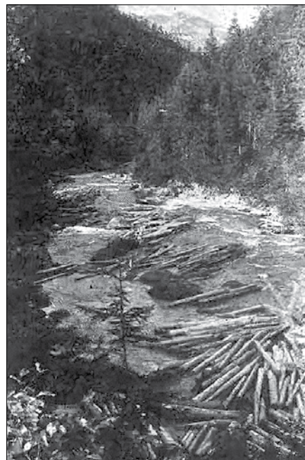
Po Savinji plavijo les (iz knjige Antona Melika Slovenski alpski svet iz leta 1954).

(graščino) Gornji Grad, katere lastnica je ljubljanska škofija s svojim v dobo njene ustanovitve leta 1463 segajočim veleposestvom. Glavna žaga te gozdne zemljiške gosposčine, žaga v Nazarjah pri gradu Vrbovcu, do katere bodo plavili desetisoč in desetisoč platanic, je do 30 kilometrov oddaljena od onih mest ob zgornji Savinji in v njenem povirju, kjer bodo začeli metati in spuščati hlode v deročo Savinjo. V tistih časih,