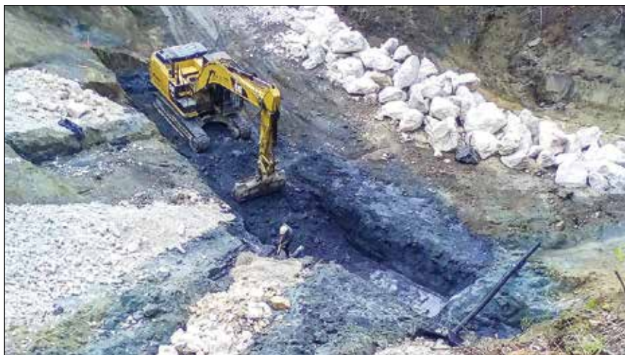
Material, ki ga je nanesele plaz, je že odstranjen.