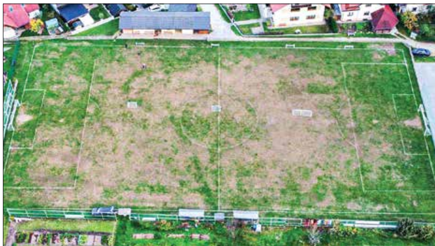
Za razbremenitev in nadomestitev v času obnove nogometnega igrišča na Forštu, ki kaže slabo travnato podobo, bo zgrajeno pomožno igrišče Gmajna.

Z drugim rebalansom letošnjega proračuna bi se prihodki povečali za 107 tisoč evrov na 4,5 milijona evrov, Povečala so se namreč sredstva, prejeta s strani države in občin. S predlaganimi spremembami bi se odhodki povečali za enak znesek na 4,6 milijona evrov. Na odhodkovni strani je tudi kar nekaj sprememb posameznih postavk; nekatere se povečajo, nekatere pa se zaradi nedokončanja ali prenosa projektov v prihodnje leto zmanjšajo. Med drugim se za 210 tisoč evrov povečuje postavka za rekonstrukcijo zdravstvene postaje na Ljubnem ob Savinji. V drugem