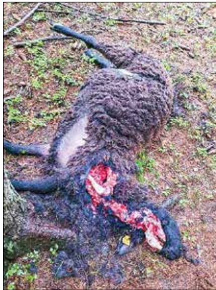
Konec septembra je čredo ovc na Solčavskem napadel volk.

in dekorativne izdelke. Na Solčavskem, kjer je ovčereja tudi pomemben segment turizma, so po zaslugi solčavskih filcark, ki se povezujejo pod imenom Bicka, razvili izjemno uspešno zgodbo predelave volne v polstene izdelke.