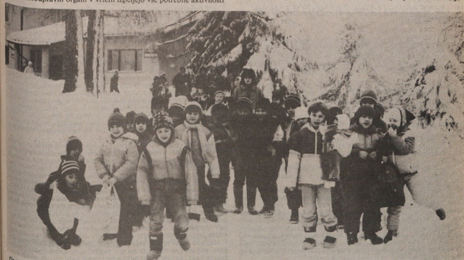
Otroci VVO Nove Jarše na zimovanju na Jančah

Predsedstvo skupščine občinske skupnosti otroškega varstva Ljubljana Moste-Polje