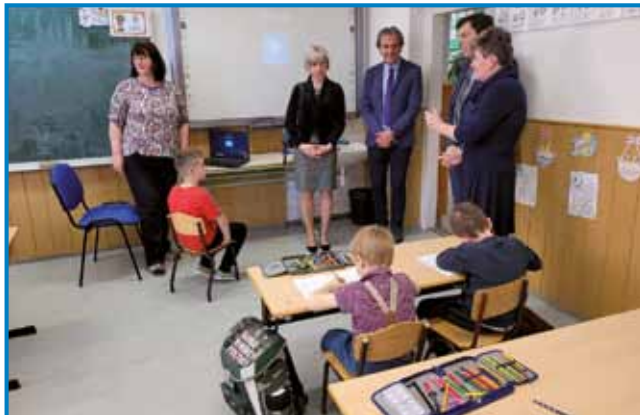
Delegacija na DOŠ Števanovci