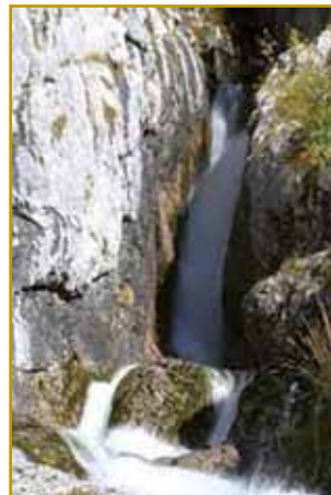
Obej reki rejsan spektakularno vö iz skal vrejta. Lejvo je izvir Nadiže na pravom kraji pa Soče (Isonzó). Ranč nej daleč je od enoga do drugoga mesta, nin telko kak od Murske Sobote pa do Monoštra. Vsikša si je svojo pau vrejzala, depa obej v enom maurdji svojo pau zgotovita, v Jadranskom maurdji.

v steroj so naše slovenske krajinje tö bile. Tak visko v V tej dvej pa pau lejtaj bitja na Soči pa kaulak nje je na