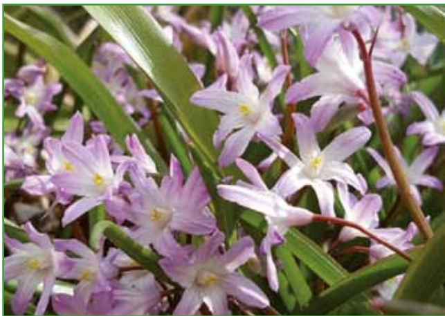
Scila - roza veverica

Jesenske čebulnice in gomoljnice so večinoma nizke rastline, na primer jesenski žafrani, ki pridejo do izraza le na izpostavljenih nezaraščenih delih gredice.