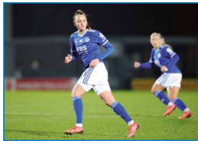
Za prvoligaško ekipo Leicester City je do zdaj odšpilala eno tekmo