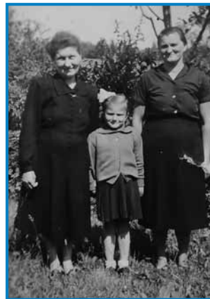
Z materdjov pa tetico