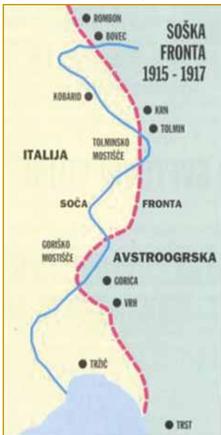
Fronta na Soči je nej vsigdar na enom pa istom mesti »stala«. V dvej pa pau lejtaj se je dostakrat vöminila

staro lüstvo, je skrak Nadiže živel. Slavi so v tau krajino prišli, za njau so se bojnali. Langobardov več nega, njiva rejč je ostanola, Slovenci pa eške itak kaulak Nadiže živejo. Nadiža staro slavsko menje ma, vejo za tau pozvani lidge prajti. Depa mi nazaj k prvi velki bojni demo, v steroj so vnaugi Slovenci mrlji, moški iz Porabja tö.