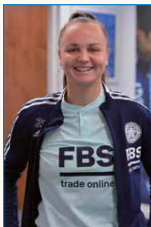
Levinja je odšla v Anglijo stran 3