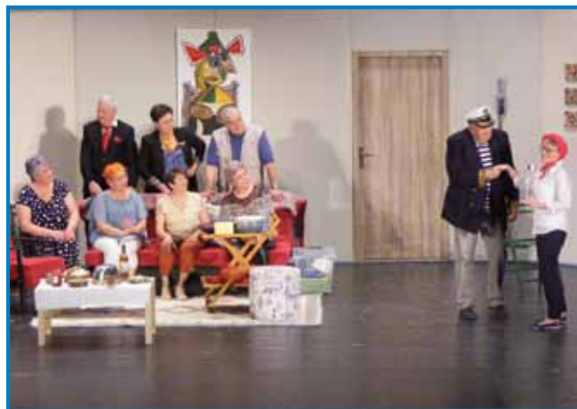
Gledališka skupina lendavskih upokojencev je uprizorila svojo šesto predstavo

nil, da je gledališka skupina v štirinajstih letih delovanja uprizorila šest gledaliških predstav za odrasle in veliko skečev, pa tudi pravljice za otroke: »Korona je v zadnjih dveh letih najbolj prizadela prav gledališko dejavnosti. A naši Kofetarji niso obupali in so se lotili priprave predstave, pri čemer jih je ves čas spodbujal režiser