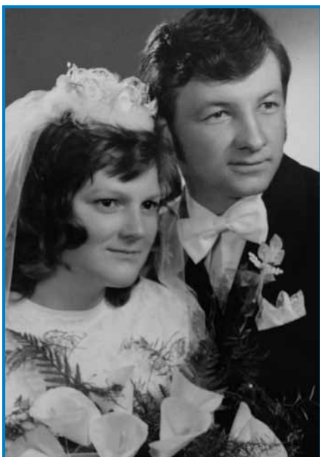
Ženila se je 1974. leta

smo gora na turbo vseli pa tak smo se pelali dola po brejgi. Depa nej gnauk, večkrat, zato ka vsikšo paut bola naglo šlau, kak je vsigdar bola trdi capaš grato. Gda brat domau pride, te vsigdar od tauga pripovejdamo, kak je bilau prvin, gda smo še mali mlajši bili v Sakalauvci.«