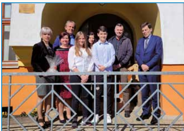
Obiske pedagoških strokovnjakov iz Slovenije stran 4