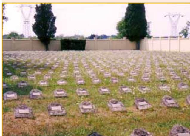
Cintor spadnjeni v prvi vojni v slovenski vesi Doberdob, stera gnes v Italiji stodji. Za tau ves se že dugo tak guči: Doberdob, slovenskih fantov grob. Doberdob pa zvekušoga vse vesi kaulak njega so v bojni do kraja uničene bile. Takši ali ovakši cintorov se eške gnes skur skrak vsikše vekše vesi leko vidi.

goraj skrak Soče se je človek obei krajaj fronte kaulak eške nigdar nej bojno. Skur 300 000 sodakov bujti bilau.