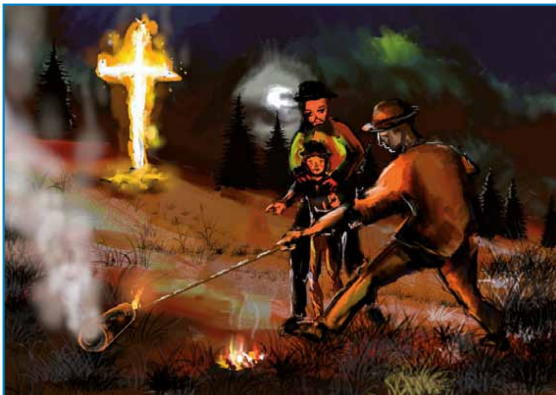
V nam bližanji slovenski krajinaj so na veuko soboto meli šegau po bregaj postavlati veuke goreče križe – s strejlanjom z možari pa so podje naganjali zimau in hüde dühove

nasečeni lejs, šteroga so vužgali. Samo té je goro, tak so ostali borovi ploki cejli.