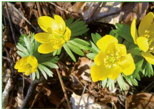
Jarica ali ozimika prva med prvimi požene cvet

ORNITHOGALUM - PTIČJE MLEKO - v umazano beli barvi je v