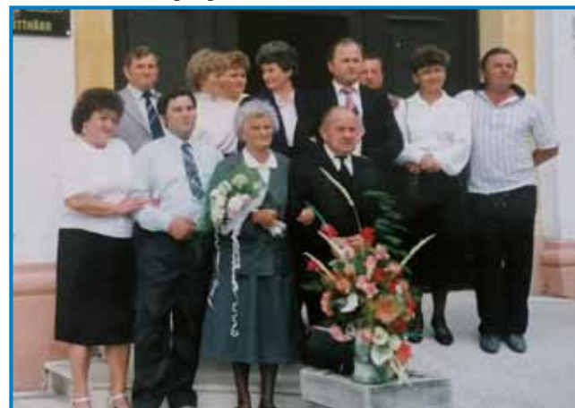
Držina na 50. oblejnici zdavanja starišov

»Tau je zato, ka sem dja najmlajša, največkrat sem sama dolavzeta z materdjov. Na drugi tjejpaj so pa brati pa sestra dolazeti, tašoga, gde smo