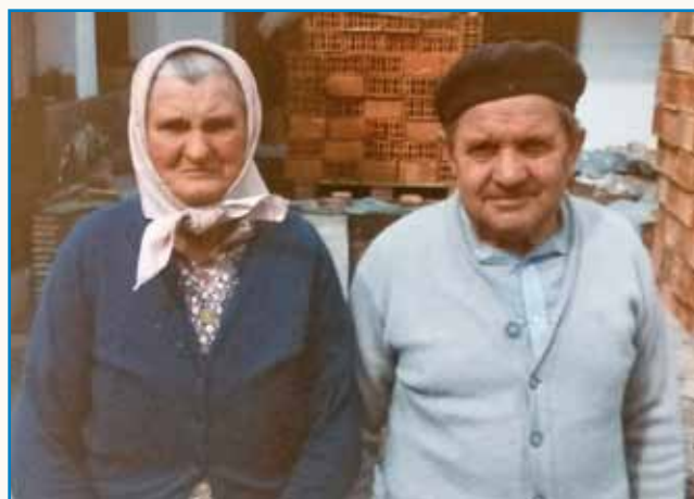
Rada mam svoj materni djezik stran 8