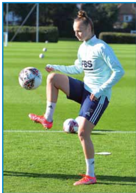
Od lanske jeseni fotbal špila v Angliji

Za Leicester City je do zdaj odšpilala samo eno tekmo, in tau v ligaškem pokali prauti drugi ekipi iz varaša Manchester, Manchester City-ji. Čiglij so tekmo zgubile z 0:5, je bilau tau za njau eno ejkstra doživetje. »Za takše trenutke trenejraš in se mant-