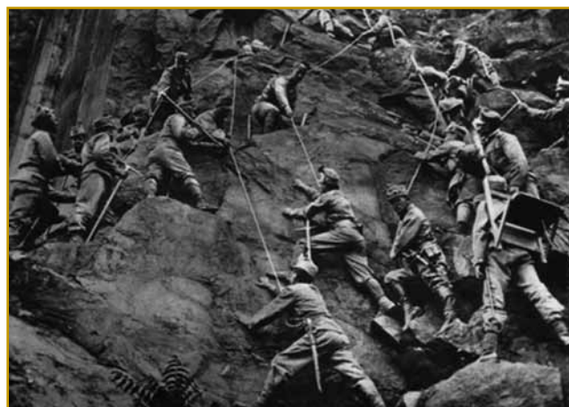
Na toj fotografiji se leko vidi, po kakšnom tereni so morali sodaki ojditi, pleziti. Tou se godi v tisti dnevaj, gda se je bitje eške kuman začnilo

v steroj so naše slovenske krajinje tö bile. Tak visko v V tej dvej pa pau lejtaj bitja na Soči pa kaulak nje je na