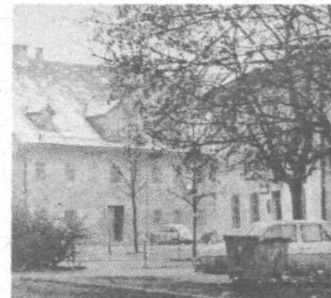
Tudi v teh zgradbah naj bi steklo novo, bogatejšo življenje.

Ker pa ob območje Trnovskega pristani, Karunove ulice in Eiprove ulice pravzaprav lahko tudi na zahodnem delu nekaterih kulturnih funkcij Ljubljane, menijo v občini Ljubljana Vič-Rudnik, da ne more postati to le naše, občinsko breme, ampak mora dobiti ljubljansko, če ne celo slovensko vrednost. Ne smemo pozabiti, da so pogosto prav s Trnovim omenjena imena slovenskih velikov Prešerna, Finžgarja, Plečnika, itn. Trnovski pristan je tudi stičišče ljubljanske mestne in