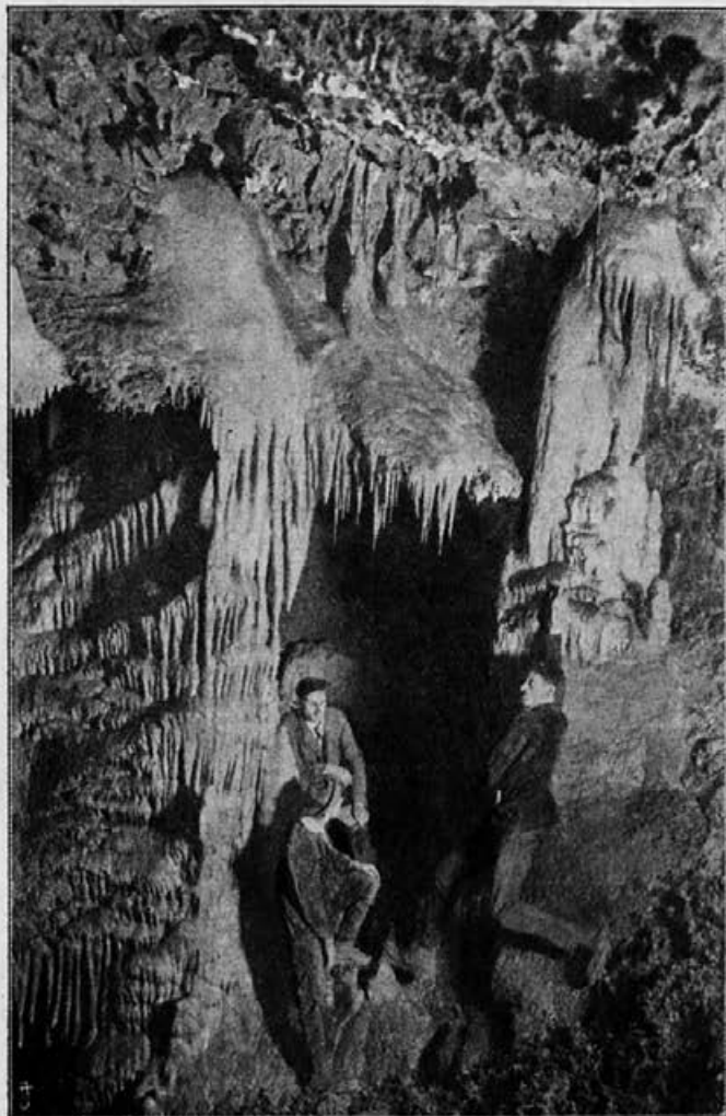
Kriviška okroglica nad Dobropoljami.