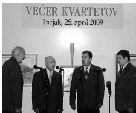
Domači kvartet Zvon je dostojno zastopal naše kraje.

Na prireditvi je nastopilo 9 kvartetov v rednem tekmovalnem delu in go-