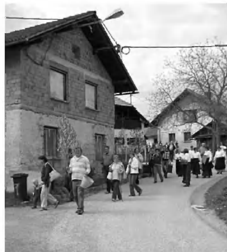
Obred na vasi.

ga čebelnjaka, ki še daje dom čebelji družini na robu vasi. Korak nam je zastal ob stari jabolani v travniškem sadovnjaku, za katero vedo domačini povedati, da ima nekaj nad 70 let. Pe-