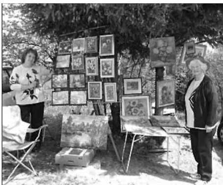
Razstava Društva likovnikov Ljubljana.