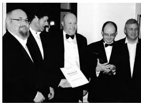
Zmagovalci večera - kvintet Sonček iz Pivke.

Med zasedanjem strokovne komisije o določitvi zmagovalca so nastopili že prej omenjeni lanski zmagovalci iz Škofje Loke in humorist Lojze iz Sodražice.