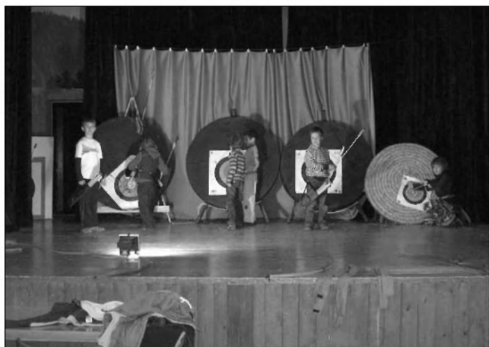
Mladi lokostrelci v Mali vasi.

Posebej je bila organizirana šola za začetnike z lastnim terminom ob torkih, ki jo je uspešno obiskovalo šest zagnanih lokostrelcev.