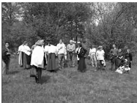
Na Gradeških Nebesih.

Jurij, ki je po legendi premagal zmaja, kar je pomenilo zmago nad poganstvom. Ljudstvo je želelo proslavljati zmago pomladi nad zimo, svetlobe nad temo, toplote nad mrazom. Prav zato se je izročilo zelenega Jurija slavilo tako kot nekoč prihod starega poganskega boga Vesnika.« S temi uvodnimi besedami je predsednik društva