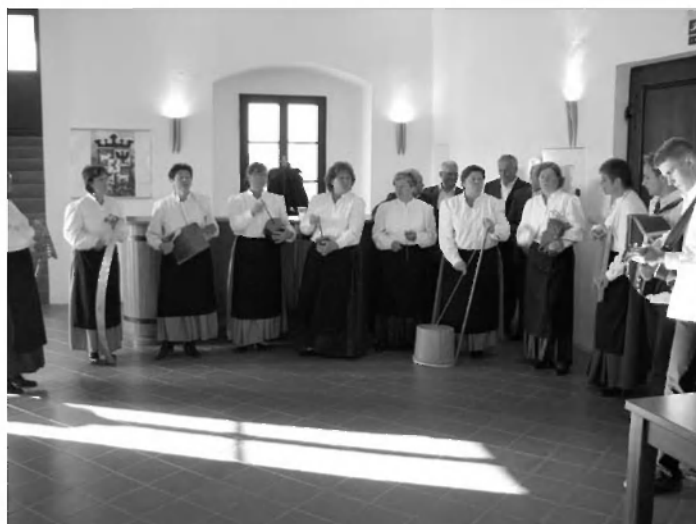
Pevska skupina »Suhe češplje« so s pesmijo popestrile program.