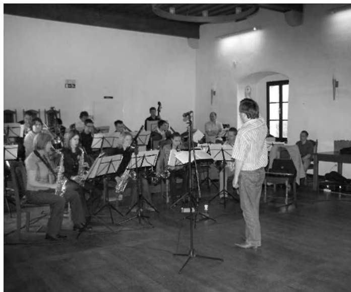
Orkester Big Band iz Vrhnik.