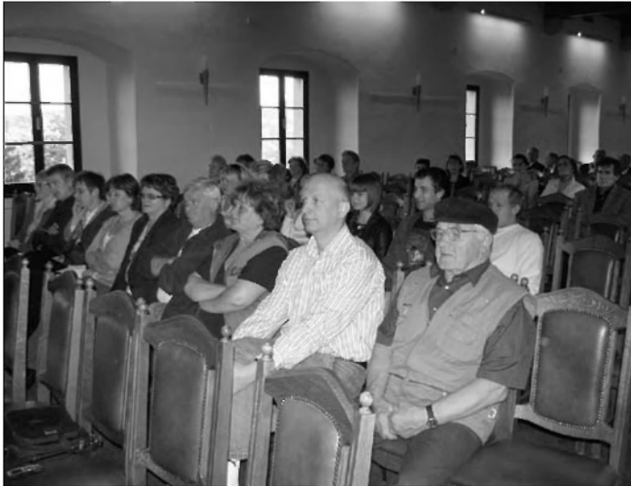
Poslušanje orkestra Big Band.