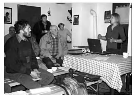
Strokovno predavanje o obrezovanju in cepljenju

Praktičen del delavnice je bil v sušilnici sadja nadgrajen še s strokovnim predavanjem, podkrepljenim s projekcijo slikovnega gradiva in predstavitvijo vrst in sort sadnih dreves s poudarkom na sortah, primer- nih za vzgojo v naših sadovnjakih. Zanimiva je bila tudi predstavitev barvnih risb raznega sadja, kaširanih na debelih kartonih, ki so jih pred več kot 80 leti uporabljali kot učni pripomoček pri pouku na osnovni šoli v Škocjanu. Že v tistem času so na šoli poučevali in uspešno širili znanje o sadjarstvu in vrtnarstvu. Risbe so razstavljene v sušilnici sadja na Gradežu.