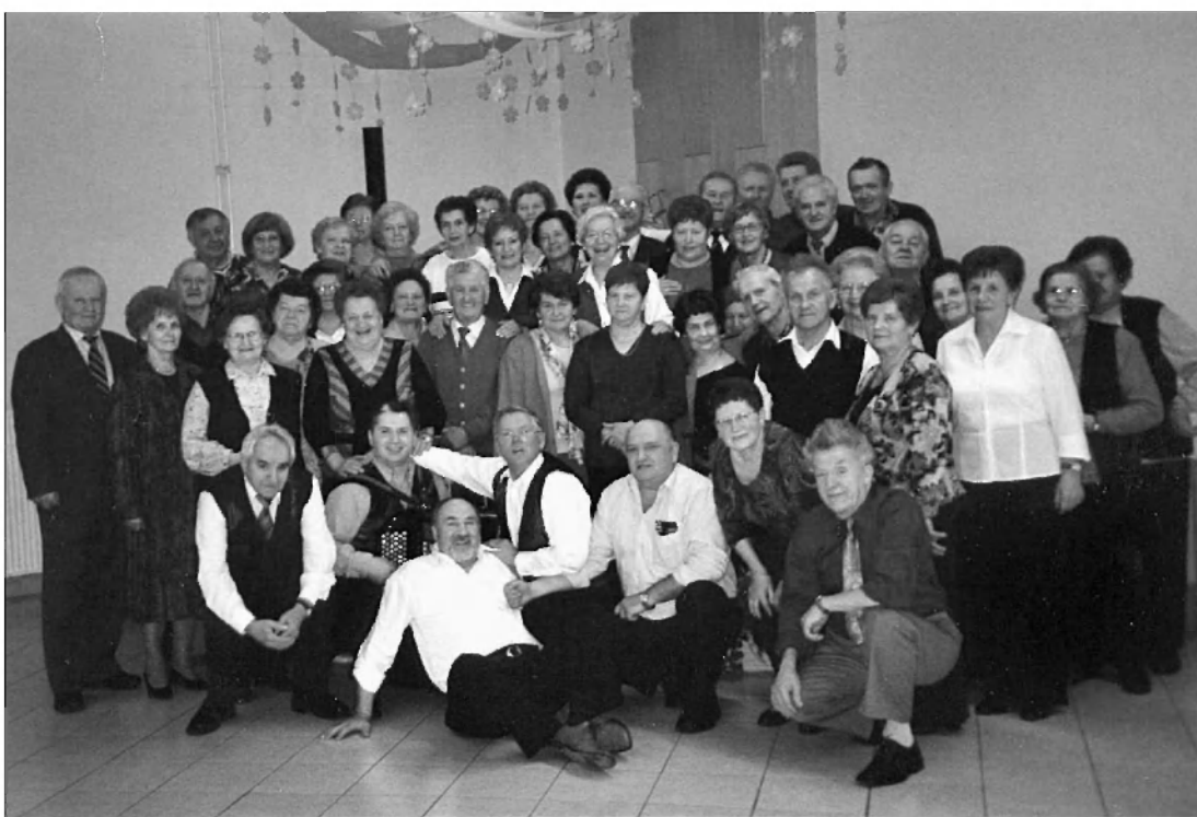
8. marec pri Puglju smo veselo praznovali.