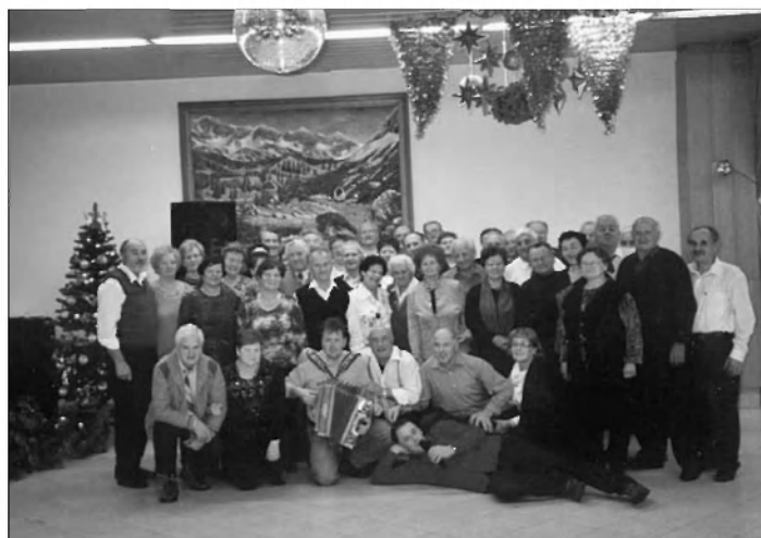
Društvo upokojencev za novo leto 2009 v Ribnici pri Puglju.