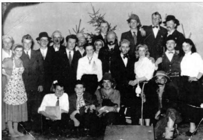
Dramska skupina Turjak, kasnejši ustanovitelji KUD Marij Kogoj (1956).

V začetku leta 1956 so bili takratni Turjaški mladinci zelo