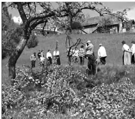
Strokovno pomlajevanje jabolane.

»Po starih vaških običajih so naši predniki častili in slavili starega Vesnika, poganskega boga pomladi, ki je v deželo prinesel pomlad. V krščanski dobi je poganskega boga zamenjal sv.