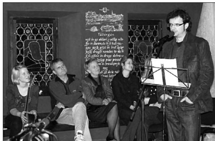
Domači nastopajoči so z zanimanjem prisluhnili avtorjem.

Portal je dnevno uredniško pregledan, pesmi s prepričljivo avtorsko poetiko pa se uvrščajo med Podčrtanke. Na portalu je tudi forum, kjer potekajo pogovori o pesnjenju, pesniške delavnice, konstruktivne kritične misli o prebranem, razprave o literarni teoriji ter medsebojno spoznavanje članov.