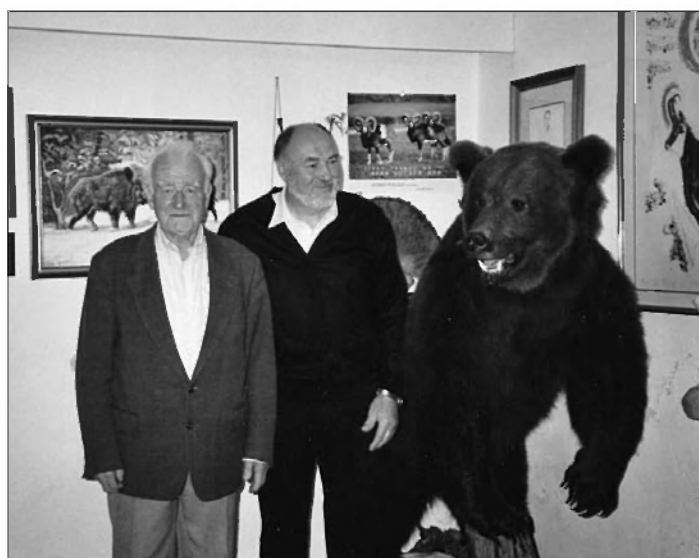
Bili smo na obisku pri najstarejšemu članu našega društva upokojencev, praznoval je 91 let.