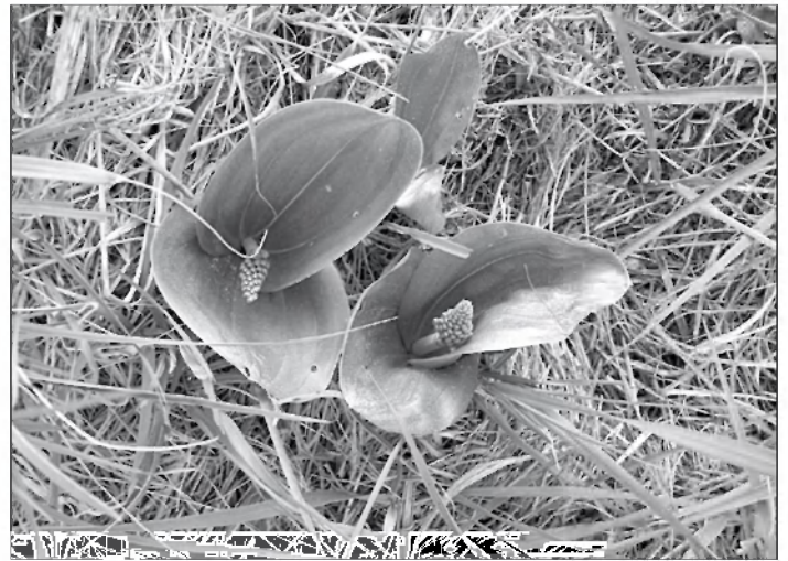
Jajčastolistni muhovnik z mokrotnega travnika v bližini Marinčkov (8.5.2009)

Kljub pomladanskemu požaru na logovih ob Robarki jajčastolistni muhovnik ( Listera ovata ) iz družine kukavičevk že veselo poganja iz zemlje. Upamo, da bo v juniju začela poganjati liste tudi Loeselijeva grezovka ( Liparis loeselii ) z rdečega seznama, ki je lani v začetku julija cvetela na istem mestu.