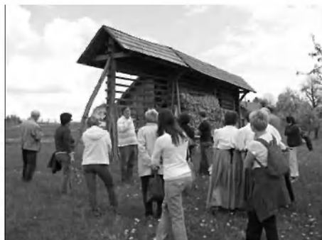
Kozolec z izvlečno dero.

za ohranjanje dediščine Boris Zore na Gradežu obudil spomin na vaški običaj in zbrane pri vaški sušilnici povedel skozi samo prireditev.