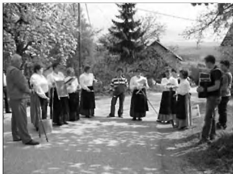
Domača pesem pri gradeški lipi.

Pod okriljem Društva za ohranjanje dediščine z Gradeža se je letos na dan 25. malega travna prvič praznovalo pomlad na Gradežu.