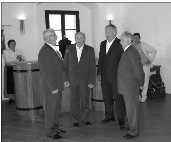
Nastop članov Kulturnega društva Škocjan.

Z odprtjem likovne razstave v stolpu gradu Turjak, na kateri so člani Društva likovnih umetnikov Ljubljana, ki so v sklopu praznovanja pomladi na Gradežu ustvarjali svoja dela na tamkajšnji delavnici, in dobrodelnim koncertom v izvedbi Društva Glasbene šole Vrhnik Big Band v viteški dvorani, se je zaključilo prvo praznovanje pomladi na Gradežu.