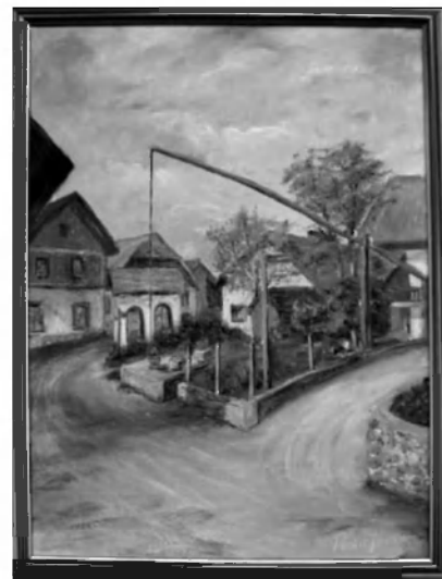
Pomladni motiv središča vasi na Gradežu. Avtorica Julijana Peršič.

Posebno zahvalo pa je namenil gostujočemu Društvu likovnikov Ljubljana za sodelovanje in razstavo ter Društvu Big Band z Vrhnik za izvedbo brezplačnega dobrodelnega koncerta.