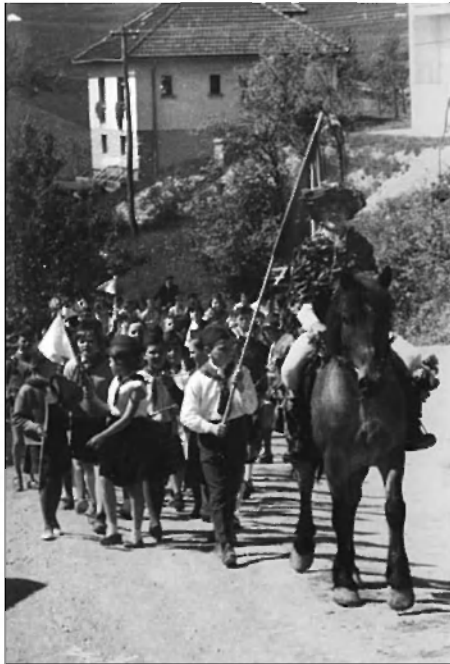
Zadnja parada Zelenega Jurija je bila 1962 v Velikih Laščah.

V najstarejši Zevnikarjevi hiši smo pokukali še v opremljeno črno kuhinjo in se v stari leseni stopi praktično preizkusili v luščenju prosa v kašo. V pomoč mlademu pomladnemu soncu je zagorela še velika grmada, otroci pa so pod strokovnim vodstvom mentorice Zavoda za kulturo in turizem Parmas izdelovali pomladne rožice iz papirja.