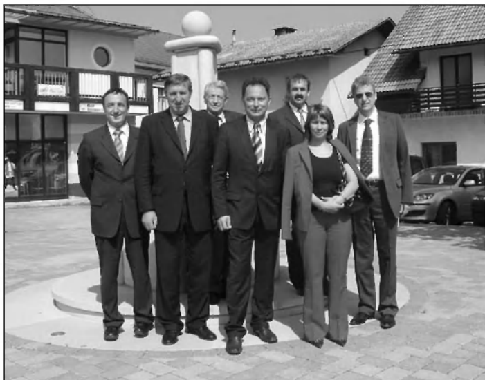
Poslanska skupina z županom in predsednikom OO SDS na trgu v Velikih Laščah.

Slovenki demokrati in demokratke v Občinskem odboru Velike Lašče smo se v letošnjem letu kar nekajkrat sestali in se pogovorili o delu naših članov v občini in na državnem nivoju. Naši poslanci in poslanke v Državnem zboru se s konkretnimi predlogi in amandmaji trudijo za hitrejše reševanje gospodarske krize v kateri smo se znašli, v občini pa se svetniki SDS v Občinskem svetu in odborih trudimo, da bi potekal razvoj naše občine tako, da bi našim občanom omogočil prijetno bivanje in hitrejši razvoj v občini.