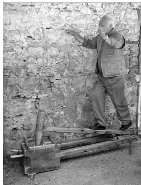
Luščenje prosa s stopo.

ter Indihar, kmetijski svetovalec KGZS je demonstriral strokovno pomlajevalno obrezovanje starega sadnega drevesa, s pomočjo katerega se drevo pomladi za več kot 15 let, hkrati pa se