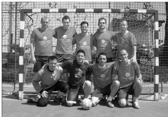
Udeleženci zadnje tekme proti GOOL Baru.

Najmočnejše tekmovanje v malem nogometu v regiji je v polnem zamahu. Ribniška liga, že od nekdaj med najpomembnejšimi tovrstnimi tekmovanji, vsaki ekipi pomeni poseben izziv. Tudi letos se je zbralo v organizaciji ŠD Lončar dvanajst ekip iz: dobrepoljske, ribniške, velikolaške in sodraške občine. V ligi tekmuje dvanajst ekip, v katerih igra skupaj 155 igralcev.