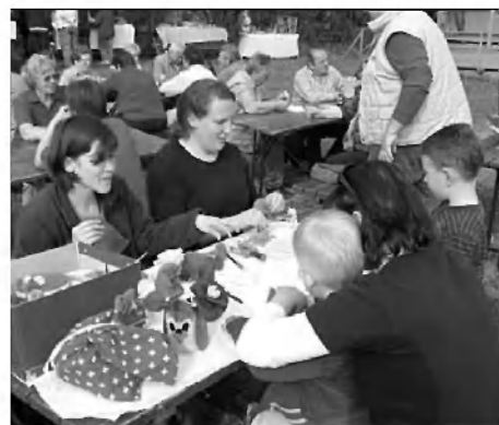
Izdelovanje papirnih rož.

na ta način uspešno pospeši tudi njegovo rodnost. S starim napevom Prišla bo pomlad, čakal bi jo rad...smo jabolani zaželeli še veliko pomladi in se povzpeli do Gradeških Nebes, kjer