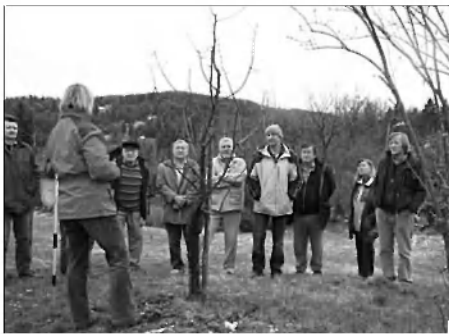
Demonstracija osnovnih pravil obrezovanja