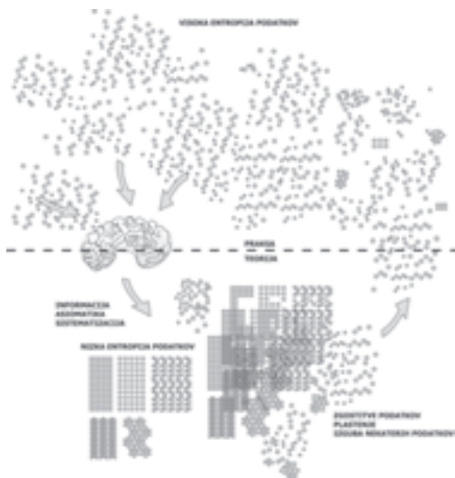
Slika 1: Entropija v raziskovanju. Entropy in the research field. (D.Zupančič)