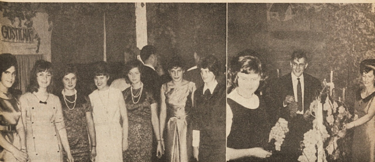
Na „vinski trgatvi“ dne 4. oktobra t. l. v Oberhausenu, Zapadna Nemčija.

so vse dosedanje prireditve potekale v največje zadovoljstvo udeležencev, ni čudno, da so prireditelji — Mladoslavenci iz Porurja — ob tej priliki ugotovili, da je prišlo na njihove prireditve v zadnjih petih letih nad 8000 (osem tisoč!) rojakov. Posebno dobro obiskane so bile prireditve za 1. maj, katerih prvi del je bil vedno kulturnega značaja z deklamacijami, nagovorom, nastopom folklornih plesnih skupin, pevskih zborov, duetov in tercetov.