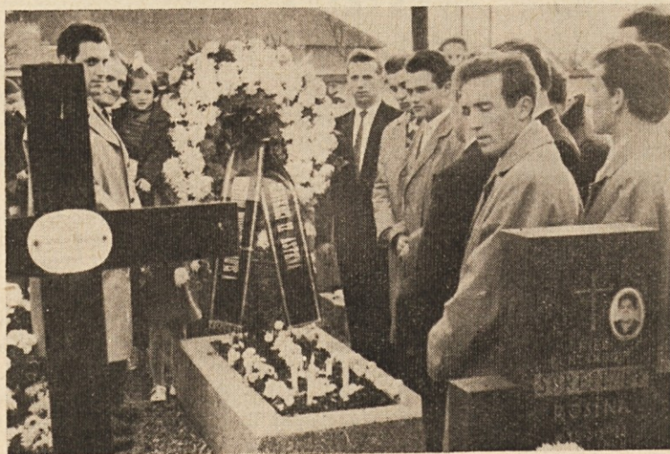
Ob Vseh svetih gremo tudi mi okoli Linza v Avstriji na pokopališče molit za naše rajne in za vse rojake, ki so našli svoje zadnje zemsko bivališče v teh krajih. — Na sliki: Venec s slovenskim napisom na Vse svete 1962 v Astenu pri Linzu.

Ko na vse to misliš, se moraš vsakikrat zdrzniti, ko sedeš v avtomobil. „Boš še prišel ven? Boš koga do smrti povozil? Si pripravljen, da stopiš tak pred Boga?“ Na vse to moraš misliti, predno se podaš na cesto. Napravi vsaj v duhu križ, preden pritisneš na plin!