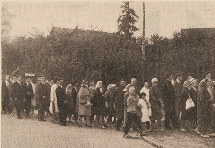
Naši romarji pri procesiji v Oskarströmu na švedskem.

Zavedajte se, da je avtomobilist v vesti odgovoren , kako vozi in v kakem stanju! Ne gre torej samo za to, da z neprevidnostjo ali brezobzirnostjo ali s preveliko hitrostjo ob nepravem času krši civilne predpise, ampak, da ima tudi greh pred Bogom, ker vedé in hoté spravlja v nevarnost svoje in bližnjega življenje. Tega si nihče ni izmislil, ampak nas sv. Cerkev tako uči! Že sv. oče Pij XII. je to poudaril, še bolj odločno pa Janez XXIII. Poleg tega nam peta zapoved prepoveduje spravljanje v nevarnost življenje brez potrebe. Ta odgovornost pa je vedno večja, ker je vedno več avtomobilov na cestah in torej vedno večja možnost nesreč.