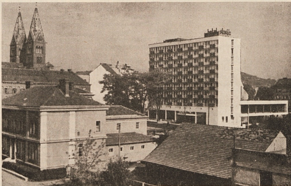
Nova podoba mesta Maribor: Novi hotel „Slavija“; na levi frančiškanska cerkev.