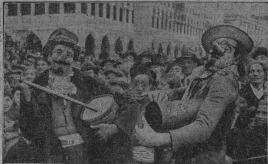
Kako so se v Benetkah v predpustu zabavali.