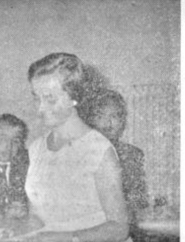
Pred dnevi je bila na gimnaziji slovesna podelitev značk in diplom vsem brigadirjem, ki so delali v brigadi na šolskem telovadišču. Proslave so se udeležili tudi zastopniki okrajnega in občinskega komiteja LMS in izrazili zadovoljstvo nad začeto delovno akcijo.

jih imajo zdaj že 636, bruto dohodek pa so v istem razdobju povečali od 97 milijonov na eno milijardo 322 milijonov dinarjev. Vzoredno s tem je narasel tudi dohodek, čisti dohodek, in zlasti še skladi podjetja od 2,4 milijona dinarjev v 1950. letu na 46,6 milijona letos. Končno je tovariš Gole opozoril še na perspektivo podjetja, ki se kaže predvsem v večjem izkoriščanju lesnih odpadkov in s tem v graditvi lesno-kemične industrije.