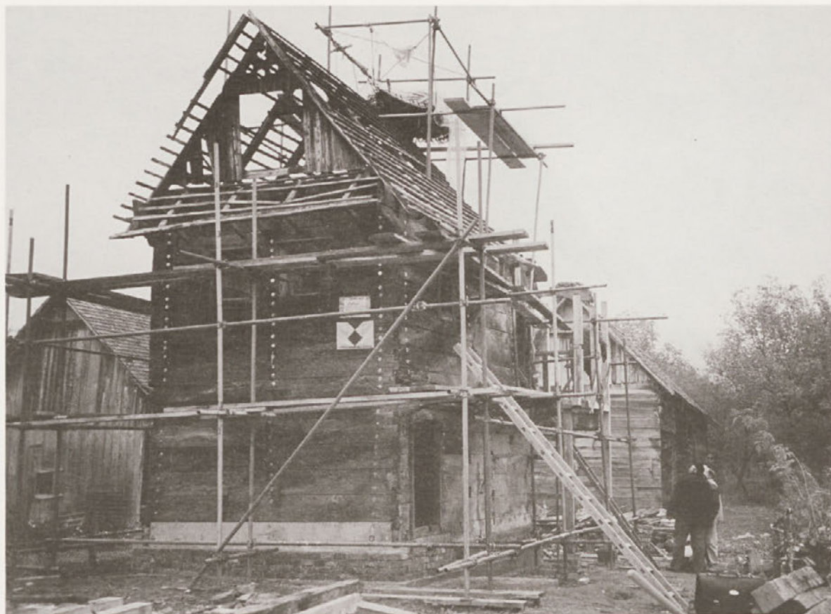
Hiša številka 26 - potek del, foto: Ana Mlinar, X-1997