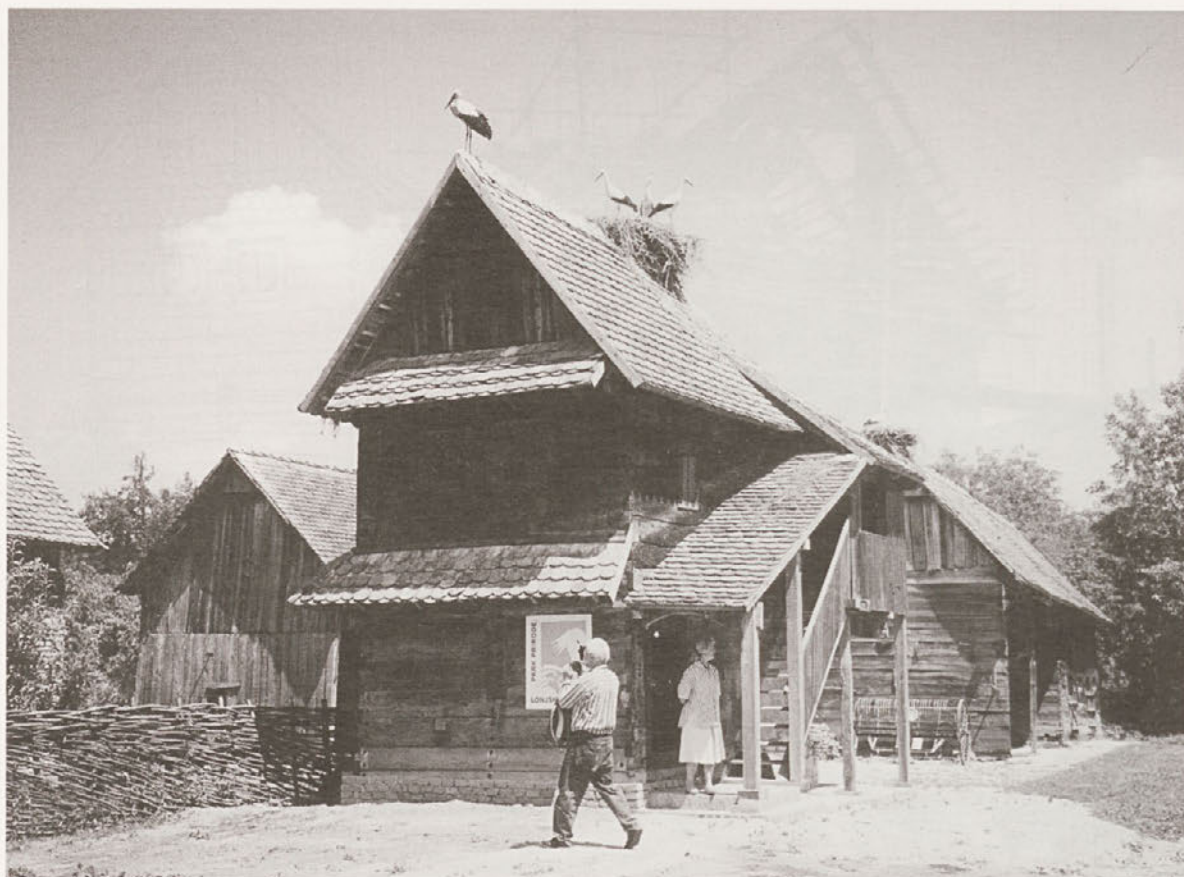
Po obnovi hiše so se vrnila štorke in celotna domačija je postala zanimiva za obiskovalce, foto: Ana Mlinar, VII-1999.

slikovito oblikovana vrata s poudarjeno geometrijsko izrezljanim osrednjim delom. Na pročelju so preprosti okraji: rezbarski zaključek slemenske lege in napušč glavnega pročelja, izrezljan z motivi krogov in križcev. Stanje pred obnovo je bilo ocenjeno kot zelo slabo z znaki ogroženosti. 14