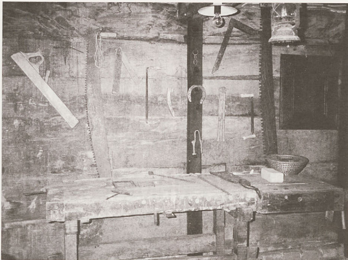
V pritličju je z obstoječimi in nekaj na novo zbranimi predmeti prezentirana mizarska delavnica, foto: Ana Mlinar, II-2000.

Kljub temu, da so že za nami, pa je treba navesti tudi težave, ki so spremljale projekt; od pravno-premoženjskih v fazi priprave fizične obnove, del, povezanih s strokovnimi dilemami, do financ. Težko je bilo najti izvajalce, saj znajo danes le redki delati z lesom po tradicionalni tehnologiji. Demontiranje in ponovno vračanje relativno krhkega materiala zahteva posebno pozornost in večji napor kot delo z novimi materiali, kot sta denimo beton, plastika ipd.