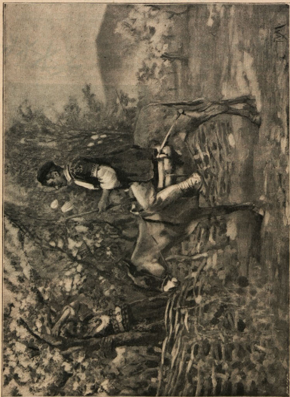
Идиллия — Idylla. (Картина отъ Софійската околностъ на Ив. Марковичка. — Слика из софійске околнѣ Ив. Мрквичке.)