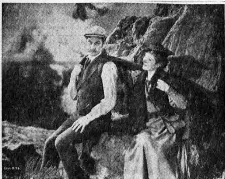
»Plašč je dovolj velik za oba,« je rekla.

»Oh, odpustite! Moral bi bil misliti na to. Ogrnite se z mojim plaščem. Meni je dovolj toplo.« »Zakaj se pa ne bi ogrnila oba in skupaj. Plašč je vendar dovolj velik za oba.«