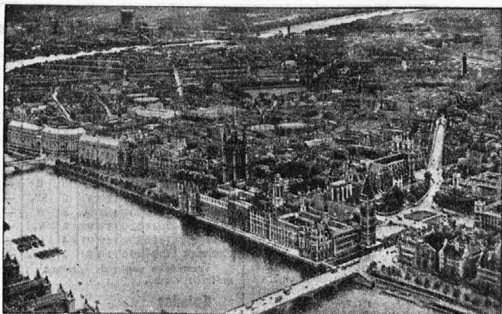
Del angleške prestolnice, ki nima ne podnevi, ne ponoči miru pred neprestanimi nemškimi letalskimi napadi.