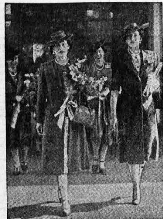
Romunka kraljica-mati Helena (na levi), ki se je po dolgih letih prebivanja zadnjic le smela spet vrniti v domovino, ko je njen sin Mihael postal romunski kralj.

V Londonu so na primer morali zaradi pomanjkljivega dovoza zelenjave in sadja izdati odlok, da smejo te stvari kupovati samo družine z otroki. Zaradi pomanjkanja živine jo je tudi vedno manj za zaloge, oziroma je bilo treba klanje živine omejiti. Industrijska proizvodnja je izgubila 16 odstotkov svoje kapacitete, kajti Nemci bombardirajo samo podjetja vojne industrije. Pri vsem tem pa ni upo-