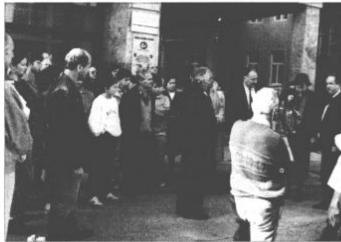
Prebivalci Strassa in še dveh avstrijskih občin so omilili stisko šoštanjskih beguncem.