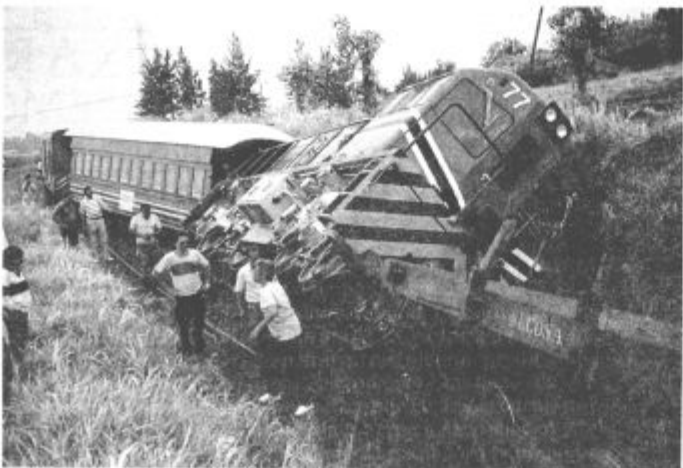
Iztirjenje vlaka v močvirskem delu Costarice

Že v San Franciscu sem dobil priporočilo za majhno naselje v bližini kraja Puerto Angel. Odpravil sem se tja in v tem naselju postavil šotor za ceno 2.000 pesov na noč (1 USD je bil takrat vreden 2.400 pesov). To je bilo skromno naselje z zelo lepo in