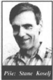
Piše: Stane Koselj

"Ne boš verjel", mi je pred dnevi dejal prijatelj, socialni delavec in strokovnjak za družinska vprašanja, "koliko napetosti in hude krvi potegnejo za sabo spolna neskladja med zakonskimi partnerji. Ljubezen res gre skozi želodec, kot so že nekdanji ugotavljali naši dedje; gre pa tudi skozi posteljo", je pristavil. Vedel sem, da ne govori kar tako, ampak iz življenjskih izkušenj ljudi, ki jim iz dneva v dan pomaga iz družinskih zagat.