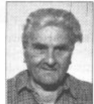
Piše: Aleksander Videčnik

O metliki je zapisano, da so jo s pridom uporabljali: