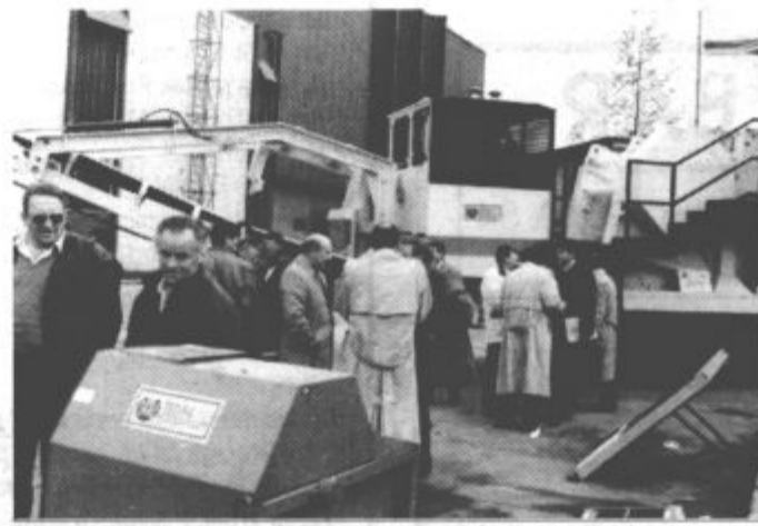
ESO se je na hišnem sejmu predstavil z mobilno sejnalno tehniko.

LDS LIBERALNO-DEMOKRATSKA STRANKA VELENJE