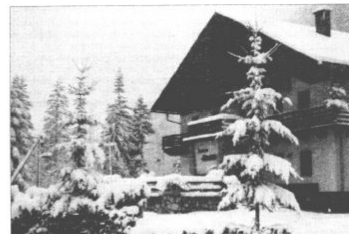
Ko bo dolino prebelil sneg, bodo pri Žoharjevih z odprtimi rokami pričakali vsakega gosta