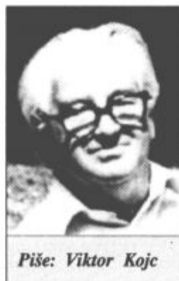
Piše: Viktor Kojc

Olepševalno društvo Šostanj je marljivo odpravljalo vse pomanjkljivosti, popravljalo poti in sadilo drevje. V Šostanju so bili znani štirje lepi kostanjevi parki in sicer na vrtu pri hotelu Avstrija (danes Kajuhov dom), na današnjem trgu Svobode, na vrtu pri hotelu Union in na vrtu pri gostilni Ograjšek v Metlečah. Kostanje in lipe pa so nasadili tudi ob Paki od mostu na Glav-