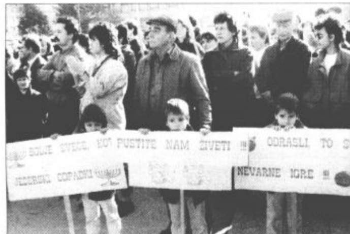
Pred petimi leti se je ekološka zavest prebivalcev Šaleške doline prebudila