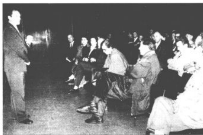
Po petih letih je veliko manj prisotnih "preležavo" iste probleme