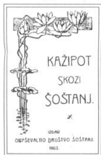
Prva stran Kažipota skozi Šostanj, ki ga je leta 1903 izdalo Olepševalno društvo Šostanj.

Šostanj, ki je postal mesto že leta 1911 je bil dolga leta upravno, gospodarsko in kulturno središče Šaleške doline ter sedež okraja in drugih institucij. Kot metropola Šaleške doline je dobil ime po Pustem gradu, katerega lastniki, šoštanjski gospodje, se prvič omenjajo že leta 1199 in bo torej čez nekaj let mesto praznovalo že svojo 800 - obletnico. Ker se je že pogreznil del Šostanja in vas Družmirje ter zelo rodovitno družmirsko polje, je nova naselbina nastala na skrajno zahodnem delu doline na Podhrastniku, ki se bo verjetno preko naselja Metleče združilo s Šostanjem. Tu je bila leta 1975 sezidana v zelo modernem slogu tudi nadomestna nova farna cerkev Sv. Mihaela, stara pa je bila