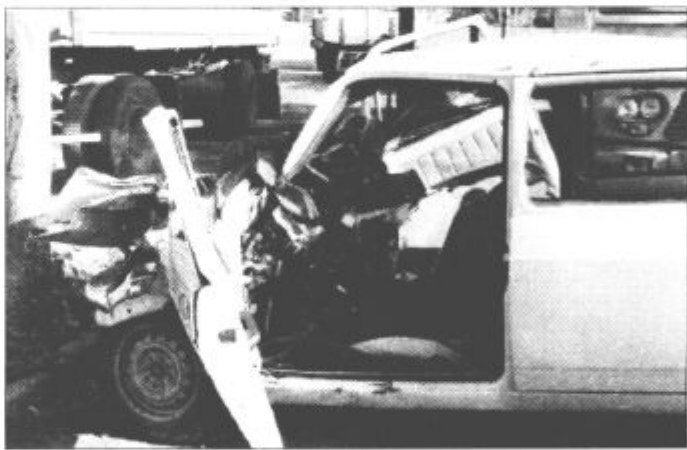
Da ne bi bilo prepogosto tako!