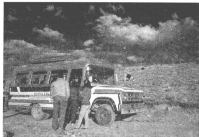
V južni Ameriki sem bil spet odvisen od avtobusov, vlakov, in tudi tovarnjakov