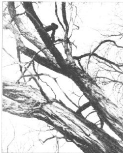
Sonce - edini zaveznik gozdov

delalo na kmečkem turizmu (subvencionirana sredstva so v veliki večini odšla na Pohorje in v Zgornjo Savinjsko dolino) in na biološki amortizaciji, ki je uničila primarno predelavo lesa (žage niso bile dovoljene).