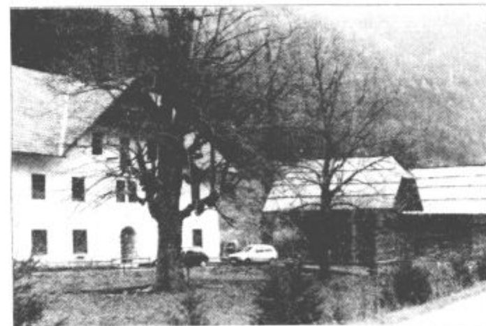
Logarjeva domačija, pred njo dve stari kašči, v katerih bo morda že čez kratek čas finska savna...