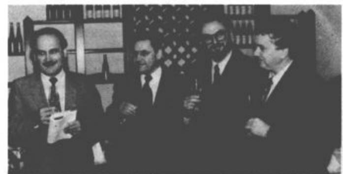
Kozarček rujnega ob zadovoljstvu in ponosu